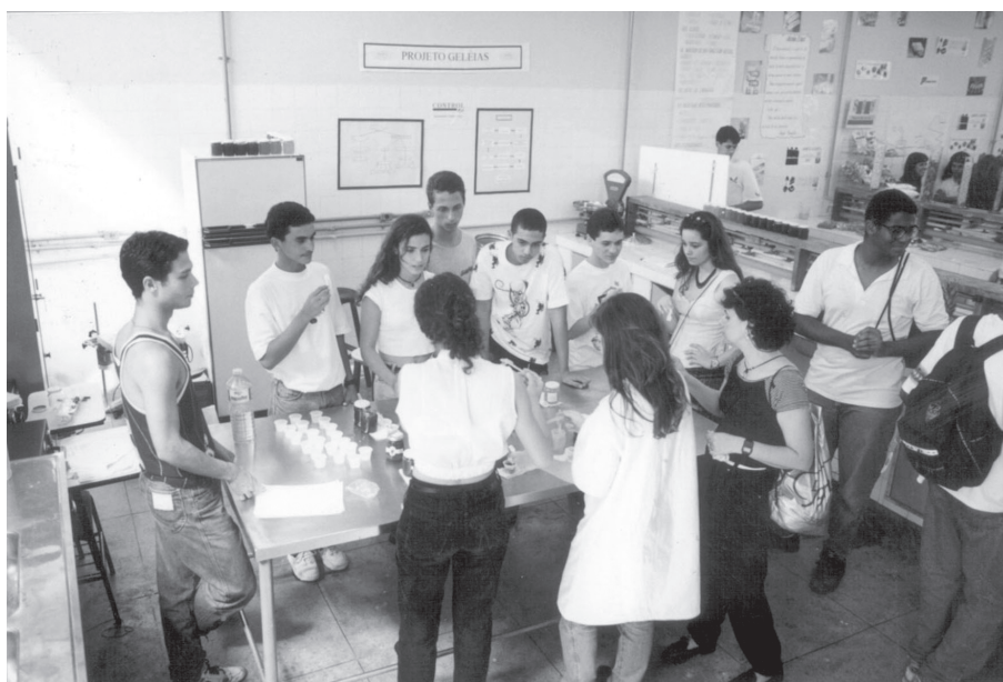
CEFETQ-RJ, autor desconhecido, 1995. “XVI Semana de Química. Nos laboratórios reproduzem-se as práticas para exibição aos visitantes – um momento para degustar a produção dos alunos do Curso de Alimentos”

Novos cursos técnicos – No início dos anos 1980, quando a Escola Técnica Federal de Química funcionava nas dependências da Escola Técnica Nacional, oferecia apenas o Curso Técnico de Química Industrial. Em 1981, acrescenta o Curso Técnico de Alimentos, o que marca o início do processo de expansão da Escola Técnica Federal de Química.