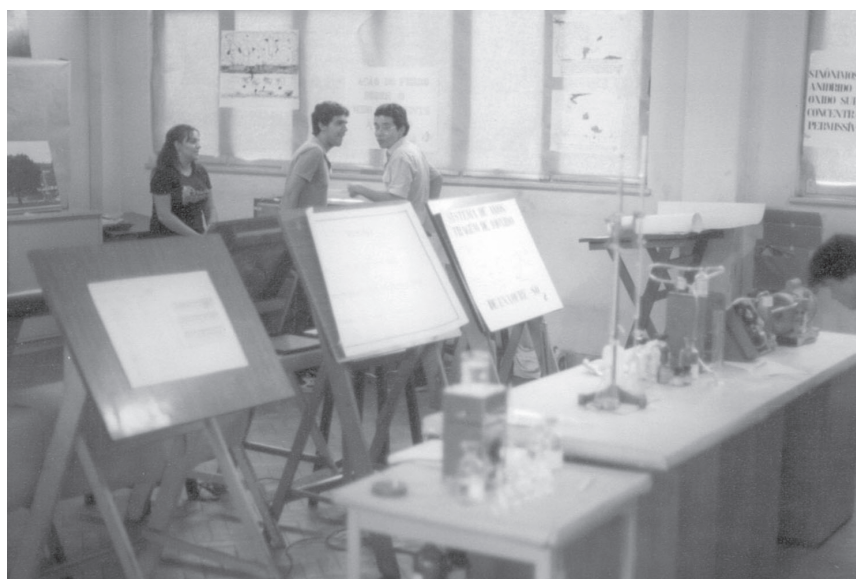
CEFETEQ, Rio de Janeiro, 1982. V Semana de Química. “Apresentação de projetos”

A Semana da Química – Entre as imagens disponíveis no acervo fotográfico do CEFET Química sobressaem aquelas relativas à realização da Semana de Química. Essas imagens constituem uma série histórica, desde 1978 20 até os dias de hoje e são de grande valor para o desenvolvimento desta pesquisa, na medida em que constituem o coroamento de atividades e projetos desenvolvidos ao longo de todo o ano pelos alunos e professores da escola.