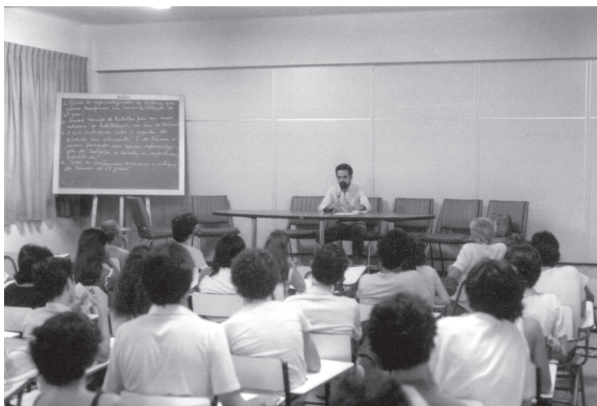
CEFETEQRJ, autor desconhecido, 1982. V Semana de Química. “Palestra ministrada para alunos da escola e funcionários da indústria”

Apresentação de minicursos, palestras e debates – “Foi a partir da terceira Semana em 1980, que os alunos passaram a reivindicar maior participação nos eventos. Nas duas primeiras edições, eles foram espectadores. A partir daí começaram a virar protagonistas” (CEFETQ, 2001: 4). Os projetos são apresentados por meio de cartazes, gráficos, textos escritos, maquetes ou de experimentos e demonstrações com equipamentos.