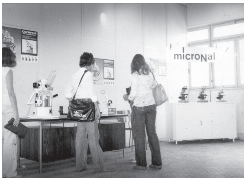
1978. “Visitação de Projetos durante a I Semana de Química, quando já estão presentes as empresas – ao fundo, estande da Micronal”

– As primeiras semanas foram organizadas com recursos da própria escola e alguma participação de empresas. A presença das empresas no interior das escolas técnicas federais está documentada desde os anos 1970, por exemplo, no registro fotográfico da visitação a projetos na I Semana da Química (1978), em que se percebe, junto à exposição de instrumentos de laboratório, o estande de uma empresa, a Micronal.