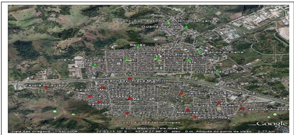
FIGURA 1 – MAPA DO TERRITÓRIO DA VILA KENNEDY

De acordo com dados do Censo Demográfico do IBGE (2010), a Vila Kennedy (vide a Figura 1 – Mapa do Território da Vila Kennedy ), também chamada carinhosamente de VK, possui 7.015 domicílios, mas segundo os dados de 2017, do Instituto Municipal de Urbanismo Pereira Passos (IPP), órgão da Prefeitura Municipal da Cidade do Rio de Janeiro, a VK tem 12,8 mil domicílios e conta com 41,5 mil habitantes. Além disso, é subdividida em áreas como: Vila Progresso, Manilha, Light, Beira-Rio, Malvinas, Leão, Congo, Chatuba, Morrinho, Alto Kennedy, Cirp, Metral, Barrão, Pedra, Sociólogo Betinho, Sapo, Picapau e Quafá.