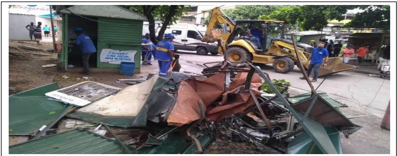
FIGURA 3 – PRAÇA DA VILA KENNEDY APÓS A REMOÇÃO