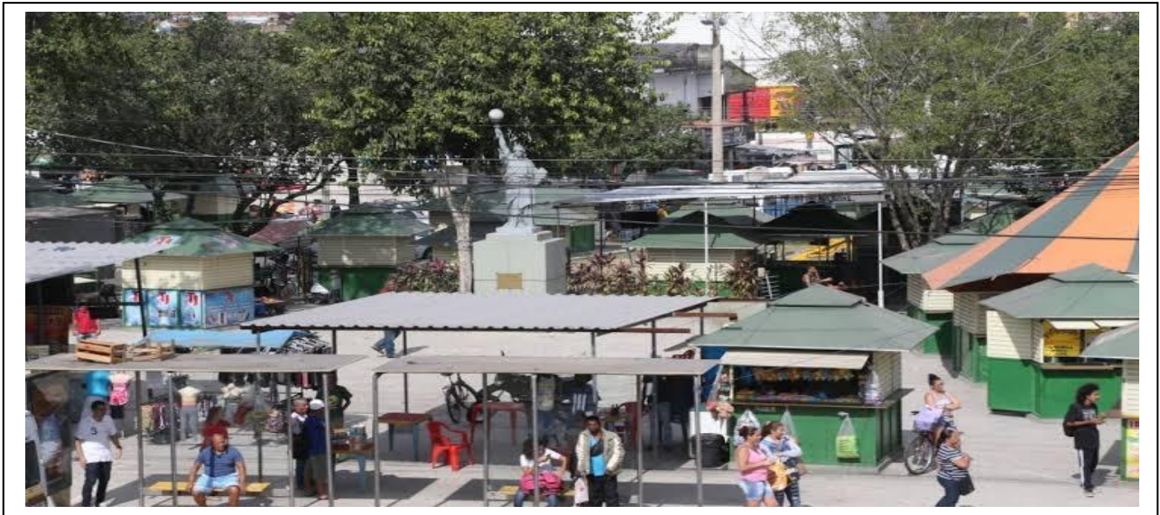
FIGURA 2 – PRAÇA DA VILA KENNEDY ANTES DA REMOÇÃO