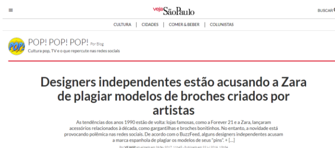
Figura 5 – Zara acusada de plagiar