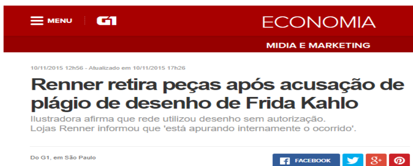
Figura 7 – Renner retira peças após acusação de plágio