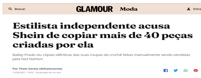
Figura 4 – Shein acusada de copiar mais de 40 peças