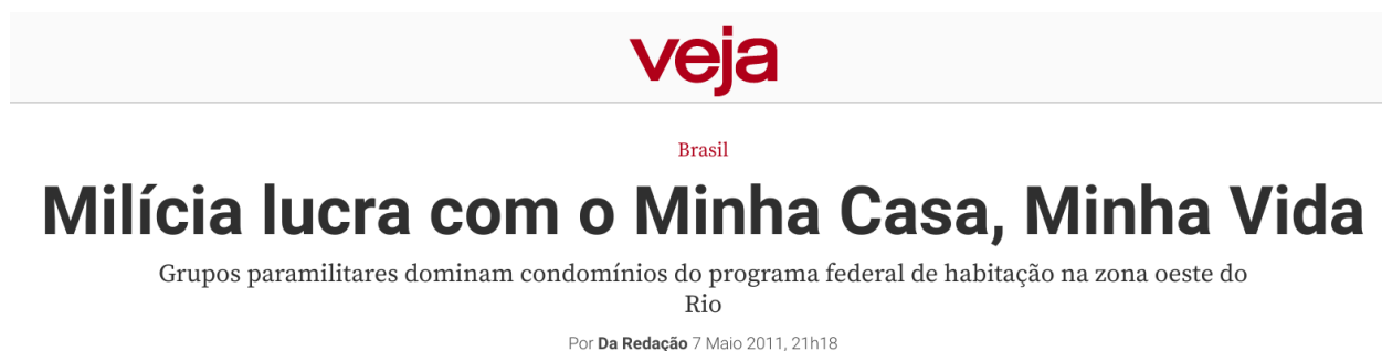
FIGURA 3 – Capa da reportagem sobre o domínio das milícias em condomínios populares

Com o domínio das milícias em territórios abandonados por uma efetiva política de segurança pública baseadas em evidências do Estado, temos casos como o dos condomínios do programa habitacional Minha Casa Minha Vida. Já em 2011, no início da política pública, a milícia já lucrava com condomínios na zona oeste da cidade do Rio, seja através de invasões ou cobranças de taxas, conforme ilustra o título da matéria da Revista Veja a seguir: