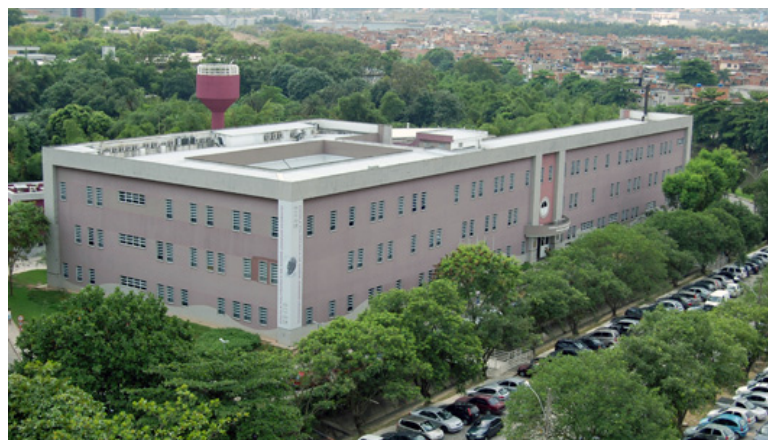
FIGURA 2 – Prédio da Escola Politécnica de Saúde Joaquim Venâncio

No meio de tantas disputas entre os grupos armados, o povo é o mais afetado em diversos sentidos. O crescimento exponencial das milícias fizeram com que, por exemplo, o medo por este grupo fosse bem maior que o do tráfico de drogas dentro das comunidades. 8 A violência afeta, inclusive, o andamento da educação: em 2019, segundo o Centro de Estudos de Segurança e Cidadania - CESeC (2022), 74% das escolas públicas do município do Rio de Janeiro tiveram ao menos um tiroteio em seu entorno, todos estes com o envolvimento de agentes de segurança pública. A Escola Politécnica de Saúde Joaquim Venâncio, inclusive, teve uma de suas portas atingidas por uma destas balas em 2017. 9