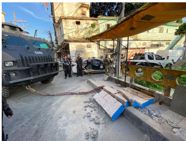
FIGURA 1 – A queda do memorial da Chacina do Jacarezinho

Esses dados estão refletidos nos telejornais que assistimos e nas matérias que lemos, e mostram a cumplicidade do Estado para tal. Nos últimos dois anos, vimos casos emblemáticos como a operação mais letal da polícia do Rio, conhecida como Chacina do Jacarezinho, ocorrida em maio de 2021 mesmo com a vigência da Arguição de Descumprimento de Preceito Fundamental 635, que restringia operações policiais durante a pandemia, podendo acontecer em hipóteses absolutamente excepcionais. Um ano depois, os inquéritos de 24 das 28 investigações das pessoas assassinadas seguem arquivados pelo Ministério Público do Rio de Janeiro e um memorial construído por moradores do Jacarezinho foi destruído pela Polícia Civil no dia 11 de maio de 2022.