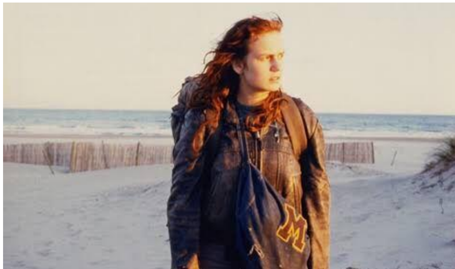
Figura 6. Cena do filme “Os Renegados”, de Agnès Varda