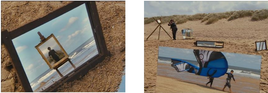
Figura 9 e 10. Cenas do filme As praias de Agnès