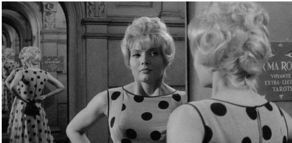
Figura 5. Cena do filme “Cléo de 5 à 7” de Agnès Varda

De acordo com Agnès, “a história de Cléo me toca: é o retrato de uma mulher, jovem e bela, fútil e adulada, que, subitamente, é obrigada a pensar na morte [...] Ela é só e sem defesa para suportar a ideia da morte” (VARDA, In: SELIER, 2005, p. 189). Varda conseguia contar histórias simples, com absoluto louvor, nas quais sempre colocava, dentro das narrativas, a mulher no papel de destaque, mostrando a diversidade da mulher como pessoa e desfazendo a caricatura de “diva” imposta à personalidade e à aparência das mulheres. Como vemos no filme de Cléo, apesar de mostrar uma protagonista fútil e obcecada por sua imagem, Varda a coloca de frente a uma situação em que ela é posta a pensar em sentimentos profundos, fazendo-a perceber a vida à sua volta.