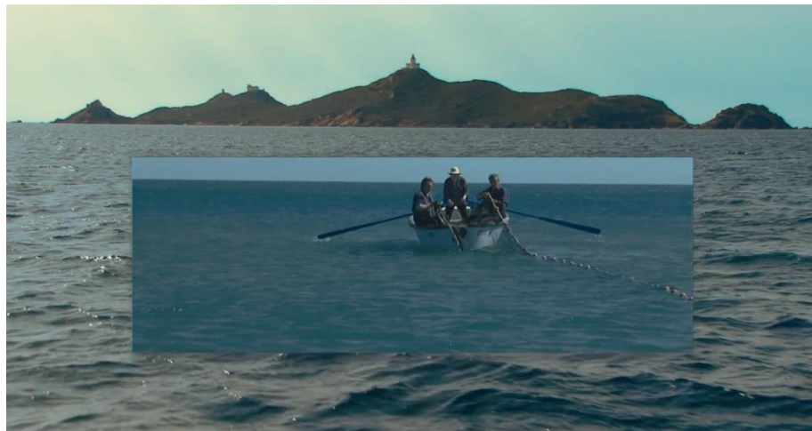
Figura 12. Cena de “As praias de Agnès”

A conexão entre seus filmes e seu passado é feita visivelmente quando, em uma cena, uma montagem é realizada, de duas fotos do mar, enquanto Agnès conta de quando fugiu de casa e o que fez ao chegar ao seu destino.