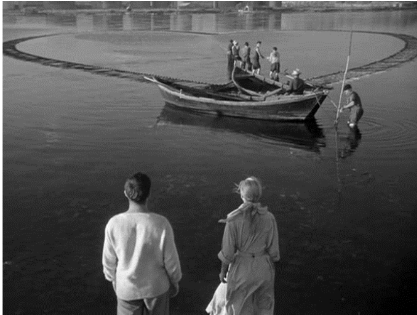
Figura 3. Imagem retirada de “La Pointe-Courte”, primeiro filme de Agnès Varda