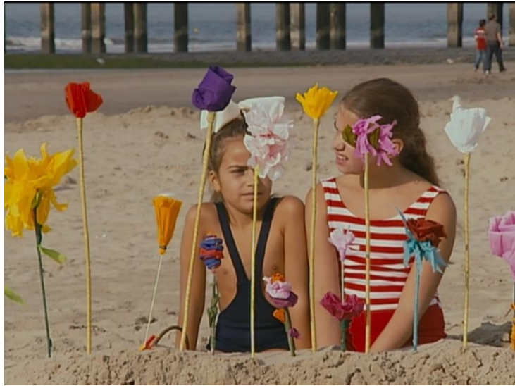
Figura 11. Cena do filme “As praias de Agnès”