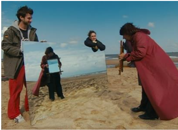
Figuras 7 e 8. Cenas do filme As praias de Agnès