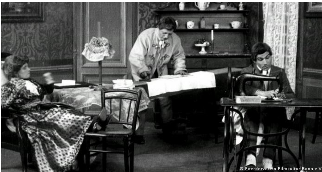
Figura 1. Mulher com os pés para o alto enquanto homens fazem os trabalhos da casa em "As consequências do feminismo"

Em 1906, Alice Guy fez um filme de comédia, pelo cinema mudo, chamado “As consequências do feminismo”, que mostrava uma perspectiva de gênero que não coincidia com o pensamento da época, pois as perspectivas de homem e mulher são trocadas e os lugares desses na sociedade se invertem. Com um trabalho de tamanha importância, questionando os papéis impostos pela sociedade, em uma época que isso não era discutido, Alice Guy marca assim o início do cinema feminino.