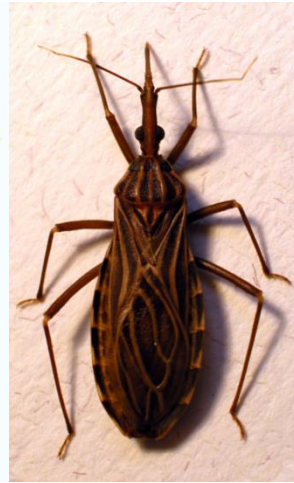
Figura 3: Rhodnius prolixus

Uma das formas que o ser humano pode ser infectado pelo parasita é por via vetorial. Os triatomíneos possuem hábito alimentar hematófago, ou seja, costumam se alimentar de sangue, e tornam-se infectantes quando realizam o repasto sanguíneo em hospedeiros vertebrados do T. cruzi que estejam infectados pelo parasita. O inseto infectado ao realizar novo repasto sanguíneo no homem, durante ou logo após a picada, defeca sobre a pele do indivíduo, e ao coçar a região acometida, o micro-organismo entra no organismo humano através da ferida (MIZOGUTI e Col. 2018). Segundo Moreno (2018), atualmente o ambiente peridomiciliar é principal local de risco para doença de Chagas. Composto de galinheiros, chiqueiros, montes de lenha, construções vazadas de depósito de alimentos e pernoite para cães. Também há casos extra domiciliares, como em caçadas e pescas realizadas em horários noturnos. O patógeno, como destacam AZAMBUJA e GARCIA (2017), não penetra a pele intacta, somente infectando o hospedeiro via mucosa ou ferimentos na pele. De acordo com Azambuja e Gracia (2017), O T. cruzi existe na natureza em diferentes populações de hospedeiros vertebrados, tais como seres humanos, animais silvestres e animais domésticos, e os invertebrados, vide insetos vetores.