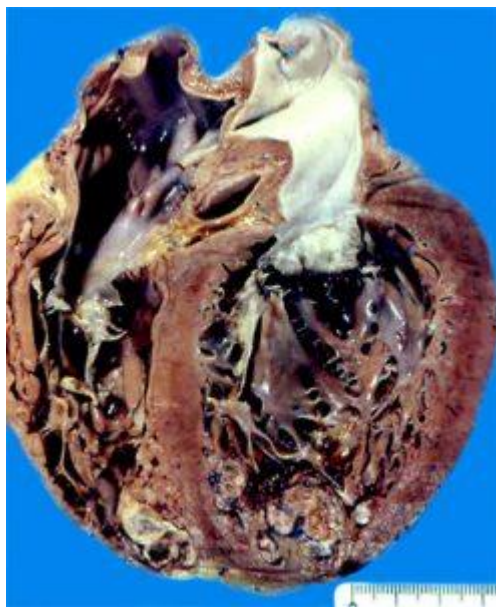
Figura 7: “Corte sagital de coração de paciente chagásico que faleceu com insuficiência cardíaca congestiva, mostrando dilatação das cavidades ventriculares, afilamento da ponta do ventrículo esquerdo e do ventrículo direito, com trombose.” (Portal Chagas, 2017)

A Doença de Chagas também é considerada uma comorbidade, e isto se tornou um agravante na pandemia da COVID-19. Foram relatados óbitos em menção a Tripanossomíase americana , no ano de 2020, os quais estão apresentados no boletim epidemiológico da SVS/MS, publicado em 2021. Em 2020, a região Norte apresentou, 13.456 óbitos por COVID-19 sendo 3 associados a Chagas; a região Nordeste, 37.775 óbitos, sendo 39 associados a Chagas (2%); a região Sudeste, 56.475 óbitos, sendo 108 associados a Chagas (1,9%); a região Sul: 8.621 óbitos, sendo 7 associados a Chagas (0,8%); a região Centro-oeste 9.414 óbitos, sendo 50 associados a Chagas (0,53%). No total, em 2020, o Brasil apresentou 125.691 óbitos por COVID-19 e 207 deles relacionados a Chagas, ou seja, 1,65% dos óbitos por COVID-19 estavam associados à Doença de Chagas.