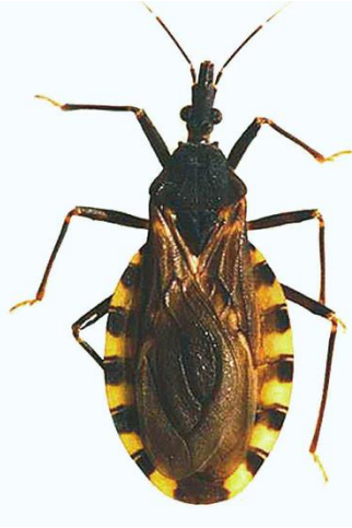
Figura 2: Triatoma infestans