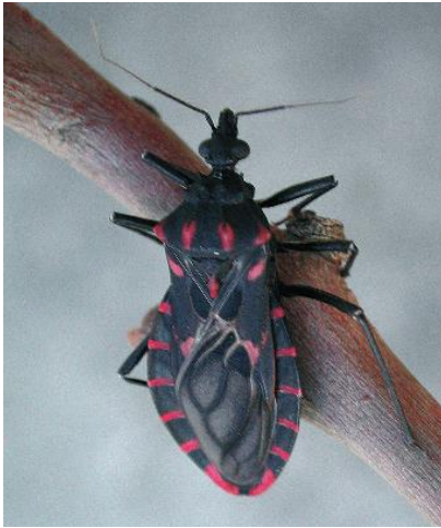
Figura 1: Panstrongylus megistus