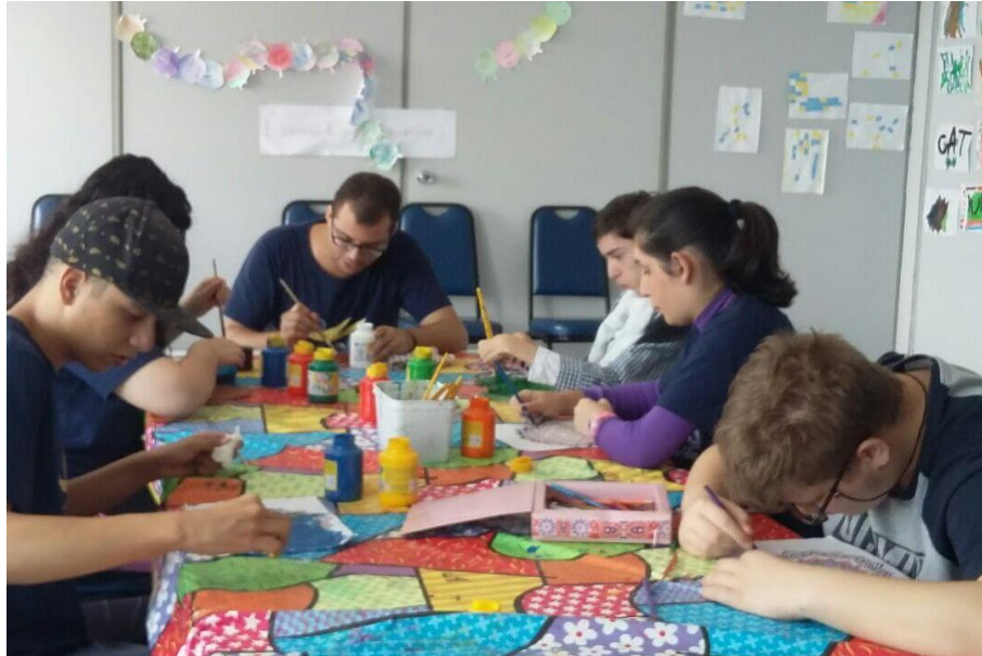
Fonte: (“Nova turma de Arteterapia da Apabb RS inicia atividades,” 2018)

Esse procedimento é bastante utilizado com pessoas com TEA, principalmente pela Arte estimular os meios de comunicação e expressão, áreas que normalmente são obstáculos para pessoas com autismo.