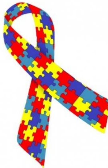
Figura 1 - Símbolo do Autismo