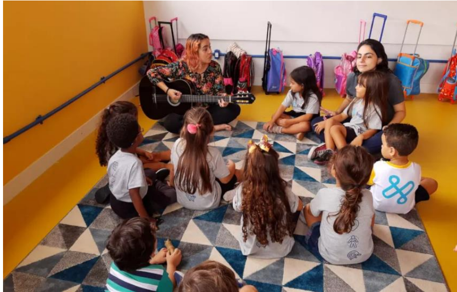
Figura 5 - Crianças da Educação Infantil em aula de música

Fonte: (“A importância da arte na educação integral,” 2021)