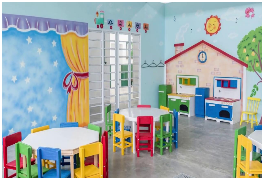
Figura 3 - Sala de aula da Educação Infantil decorada

Ressalto também que o excesso não é favorável, o que se chama de poluição visual, isto é, o estímulo visual em abundância, pode acabar escondendo o que pretende mostrar, não deixando espaços para que a criança possa inventar. Espera-se que os materiais de mediação de uma sala de aula da Educação Infantil tenham um equilíbrio expressivo, ao mesmo tempo que incentiva a criação do aluno, também dá espaço para a aprendizagem de algo novo.