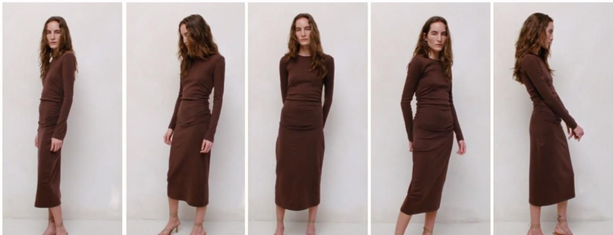
(Figura 1: site da Zara. Disponível em: < https://www.zara.com/br/pt/sustainability-products-mkt1455.html?v1=1468721 >. Acesso em: 9 Março 2022)

Bem como é expressado no filme “O diabo veste Prada”, na cena do suéter azul celeste, evidencia justamente a estratégia que a Zara utiliza: esperar uma tendência se concretizar para assim começar a produzir em massa as roupas com quase nenhuma modificação, não levando em consideração os estilistas que as produzem, àquelas que foram pensadas, e desenvolvidas por estilistas e marcas renomadas 8 , visando apenas, atender uma ânsia consumista. Nessa cena mostra o ciclo que a moda faz: primeiro é pensado, criado e lançado a tendência de moda, - no fragmento do filme a Miranda ao ver que a Andrea ri ao ouvir que os cintos que são de cores parecidas, para ela, na verdade são diferentes. Logo, a Miranda começa a explicar como surgiu e que não é um simples azul, mas sim o azul celeste e acrescenta: “em 2002 Oscar de La Renta fez uma coleção de vestidos azul celeste e eu acho que foi YSL que fez jaquetas militares azuis celeste.” - logo depois fala do segundo passo do circuito da moda: aparição do azul celeste nas coleções de 80 (oitenta) outros estilistas, chegando nas lojas de departamento, à lojas populares e por fim levando a liquidação pois as peças não foram vendidas, não podendo esquecer que o destino final dessas peças são lixões a céu aberto, tendo em vista que já é gerado no público-alvo uma nova ânsia de consumo. É nesse momento de geração de novas ânsias de desejo que o circuito curto da moda recomeça.