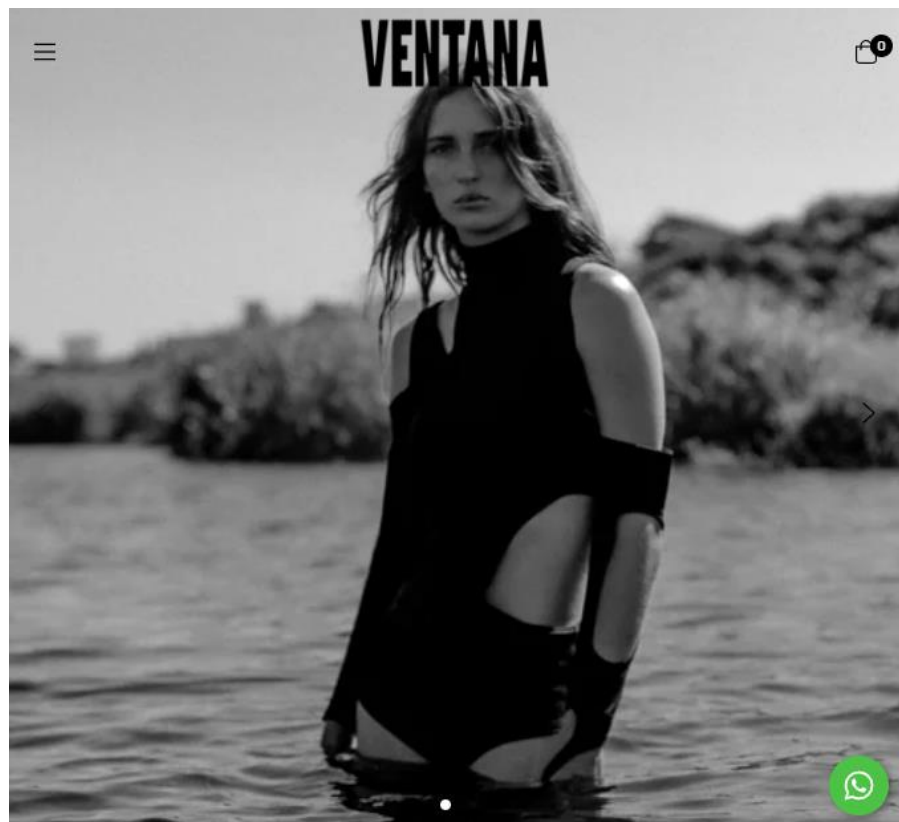
(Figura 2: site da Ventana. Disponível em: < https://useventana.com/ >. Acesso em: 9 Março 2022)

A marca expressa seu compromisso através do seguinte texto, retirado do story , de apresentação no Instagram da mesma: “Buscamos aplicar em peças de segunda mão e sobras de tecido nossa identidade. Criando e recriando novas histórias para aquilo que deixou de fazer sentidos para outras pessoas”. Diferente da Zara que apenas produz o que já é de fato tendência, ou seja concretizado. A Ventana é uma marca apenas online, utiliza do Instagram para a propagação de suas campanhas e processos, seu vetor é o conceito slow como estratégia de crescimento no mercado. Ela vem como uma resposta a esse modelo rápido de aquisição de roupas, ainda que acompanhe os anseios sociais, torna as peças únicas sob seu olhar criativo. Uma produção de baixo impacto ao meio ambiente e ecodesign.