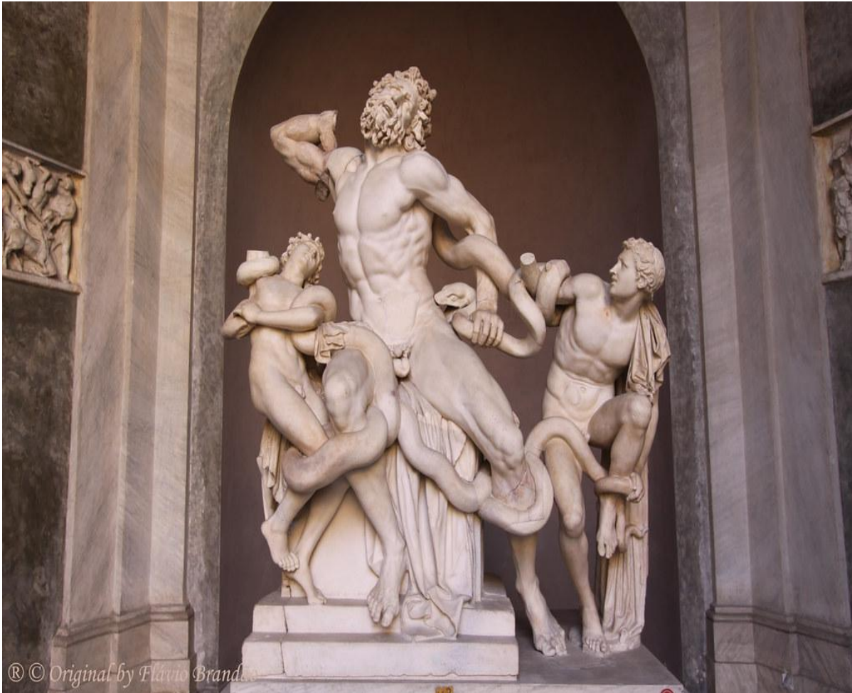
Figura 1 — “Laocoonte e seus filhos”