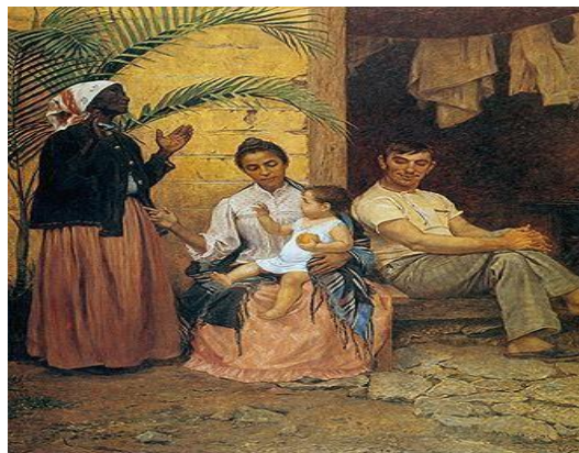
Figura 1 5 - A redenção de Cam (1895) de Modesto Brocos. Óleo sobre tela, 199cm x 166cm. Rio de Janeiro: Museu Nacional de Belas Artes.

De acordo com Lotierzo e Schwarcs (2013), a obra expressa em detalhes, o que os teóricos vinham dizendo sobre o progresso que a imigração traria, isso fica explícito na figura da família em gerações diferentes e representadas da seguinte forma: da avó negra pisando na parte sem asfalto e olhando para o alto como em gesto de agradecimento, a filha mulata com traços mais suavizados, o pai branco e estrangeiro com os pés na parte pavimentada e de costas para o que seria o passado e o filho no colo da mulher, também branco e homem, o autor do artigo ainda aponta para as marcas de gênero expressas como sinal de progresso. Segue abaixo, a representação do quadro: