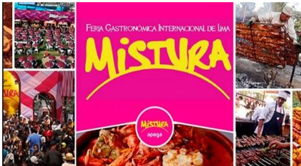
Figura 6- Poster de apresentação do Festival Mistura