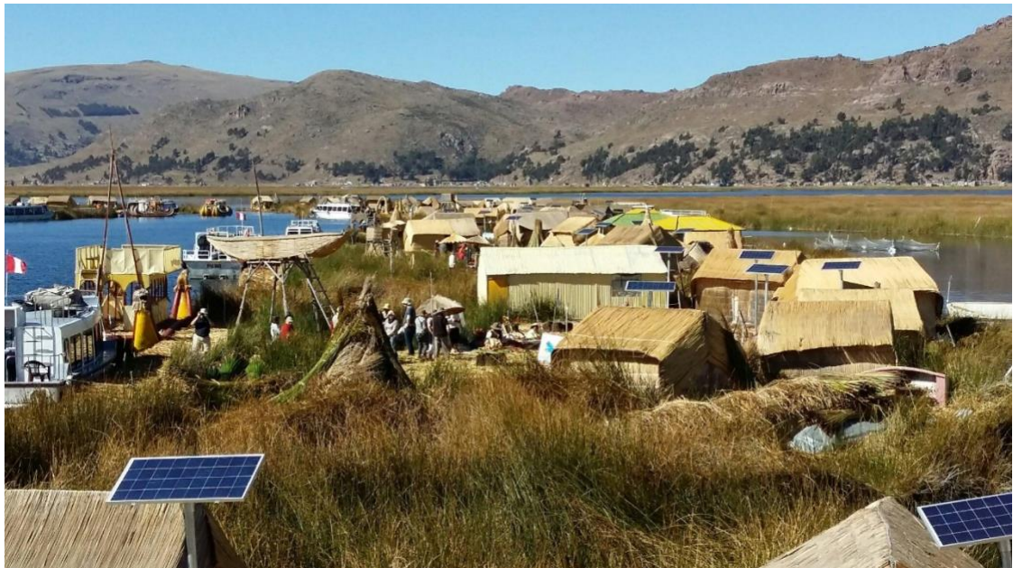
Figura 8- Foto de Turista no site Tripadvisor “Uros Experiences Peru”

Disponível em: http://www.tripadvisor.com.br/