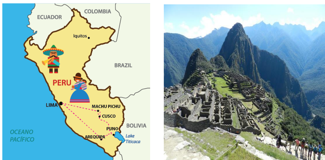
Figura 1: Mapa do Peru e Machu Picchu