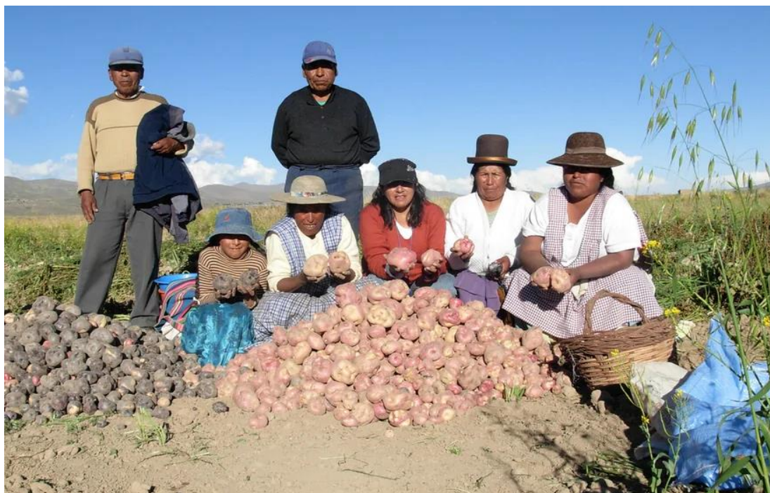
Figura 4- Camponeses e sua colheita de batata ( papa )

Na época da civilização Inca as mulheres de uma classe social mais baixa eram bem envolvidas no processo de plantio e na cozinha, como produziam seu próprio alimento, muitas vezes seus companheiros necessitavam de ajuda no cultivo, sendo assim o trabalho rural para as mulheres de classe mais baixas também existia em grande potência, não somente eram Donas de casas, mas também cuidavam de seus filhos e ainda passavam grande parte do seu tempo cozinhado e cultivando seus alimentos (MISAKA,2020).