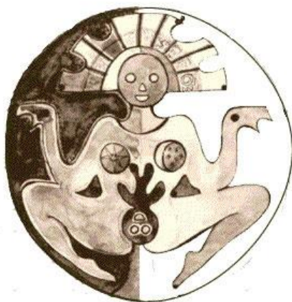
Figura 5- Pachamama: Madre Tierra

Uma grande representação da mulher na cultura Andina até os dias atuais é a chamada Pachamama a mãe terra e divindade máxima, o culto a Pachamama é o mais importante nos territórios andinos, uma herança da civilização Inca. A mãe terra modelo de nascimento, maternidade, fertilidade ( mama ) e também em sua totalidade ligada aos conceitos de terra, espaço, divino, sagrado ( Pacha ) está presente desde a civilização Inca sendo cultuada diariamente pelo povo Andino como a grande mulher protetora de suas terras e da população (MISAKA,2020).