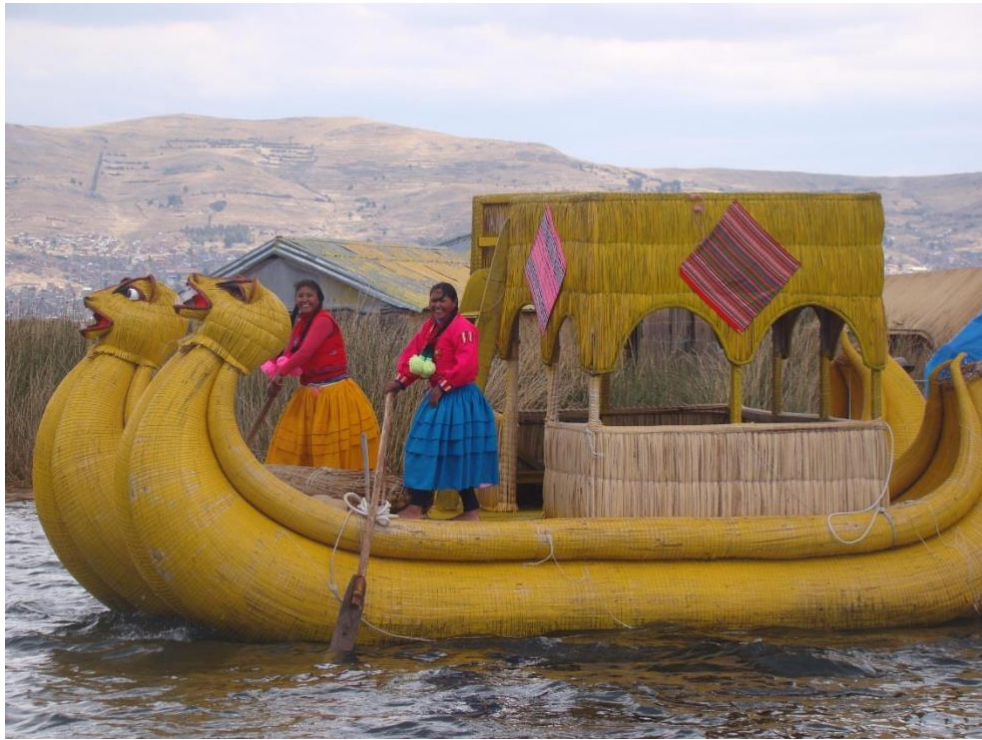
Figura 7- Foto de Turista no Site Tripadvisor “Navegando por el Titica”