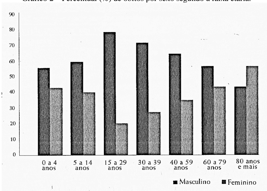
Gráfico 2 – Percentual (%) de óbitos por sexo segundo a faixa etária.