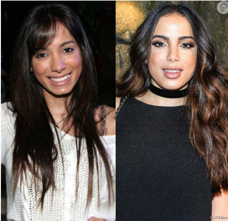
FIGURA 1 – Cantora Anitta antes e depois das cirurgias.