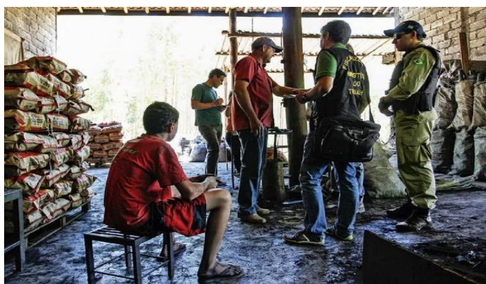
Figura 5 – Fiscais encontram um caso de trabalho infantil em uma carvoaria, edição 2553/2017.