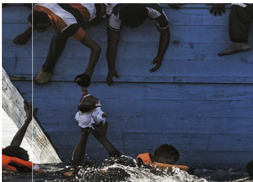
Figura 2 – Imagem da Semana, edição n° 2499/2016.