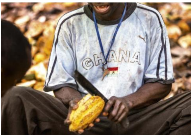
Figura 6 – Casos de trabalho infantil em uma plantação de cacau, edição 2471/2016.