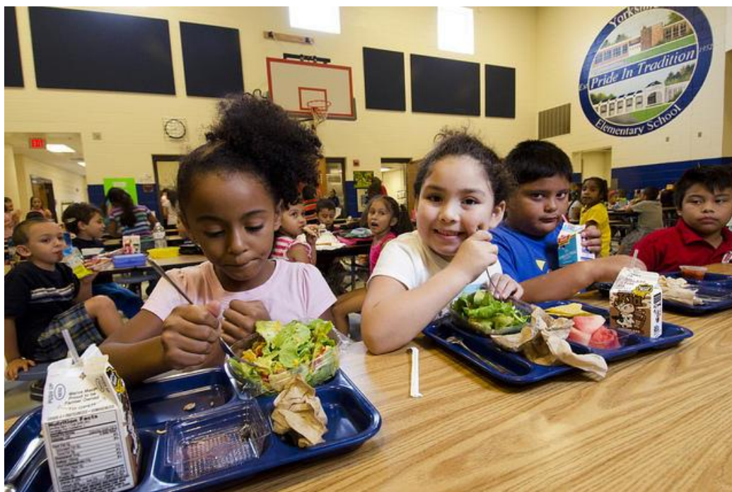
Figura 8 – Crianças durante refeição na escola.