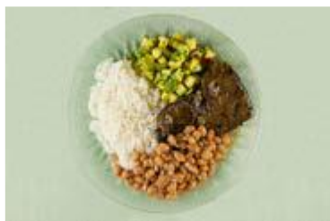
Arroz, feijão, fígado bovino e abobrinha refogada.