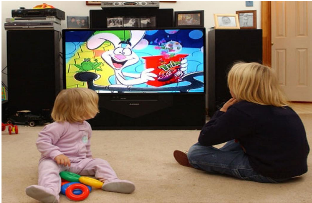
Figura 6 – Crianças assistindo TV durante a exibição de um comercial de guloseimas.