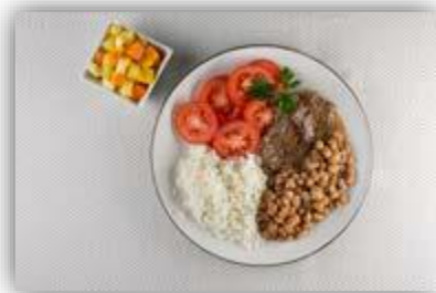
Salada de tomate, arroz, feijão, bife grelhado e salada de frutas.