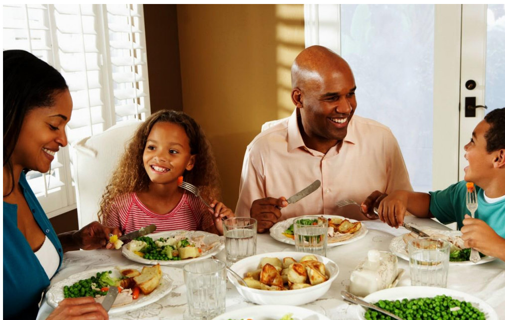
Figura 5 – Pais e filhos durante refeição à mesa.

O exemplo alimentar dos pais é considerado um fator determinante nos hábitos alimentares infantis. Por serem consideradas figuras importantes para a criança, suas ações exercem influência sobre elas, incluindo a alimentação. Caso consumam alimentos adequados do ponto de vista nutricional, são grandes as chances de seus filhos aderirem aos mesmos hábitos alimentares no futuro (PONTES et al , 2009).