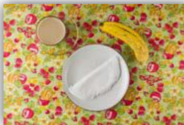
Café com leite, tapioca e banana.

Segue abaixo exemplos de refeições saudáveis, nutritivas e variadas e com alimentos in natura do café da manhã, almoço e jantar, respectivamente: