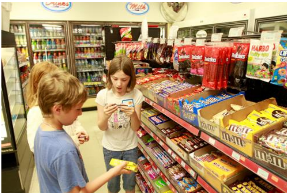
Figura 7 – Guloseimas ao alcance de crianças no supermercado.