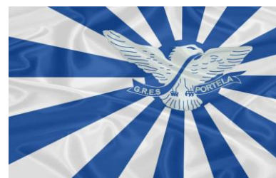
Figura 7: Bandeira da Portela