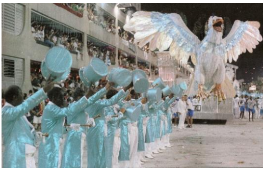
Figura 2: Comissão de Frente da Portela, 1991

a coordenação, o sincronismo e a criatividade de sua exibição, podendo evoluir da maneira que desejar. (LIESA, 2016, p.46)