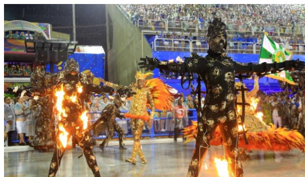
Figura 4: Comissão de Frente da Mocidade, 2015