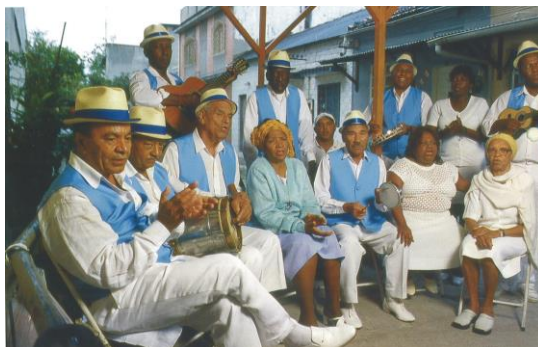
Figura 1. Velha Guarda da Portela