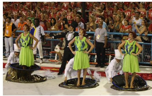
Figura 3: Comissão de Frente da Unidos da Tijuca, 2010