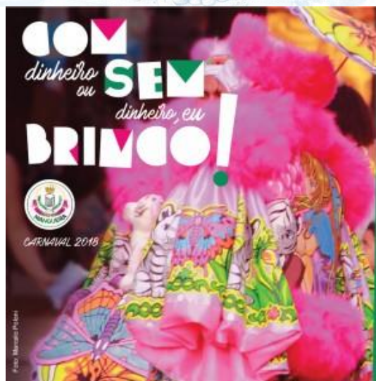
Figuras 14, 15 e 16: Enredos críticos do G.R.E.S. Paraíso do Tuiuti, G.R.E.S. Beija Flor de Nilópolis e G.R.E.S.E.P. Mangueira, respectivamente, 2018