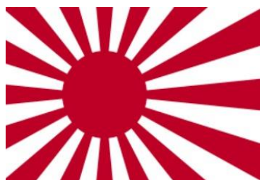
Figura 6: Bandeira do Japão no século XX