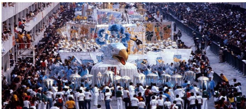
Figura 12: Desfile Campeão da Portela, 1984