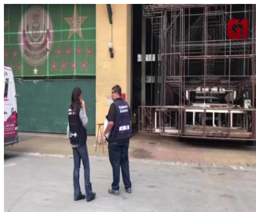
Figura 11: Fiscais da Vigilância Sanitária na Cidade do Samba