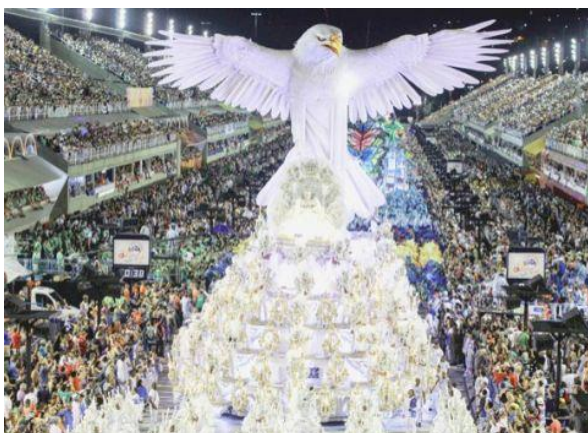
Figura 10: Águia Redentora no carro abre-alas, 2015