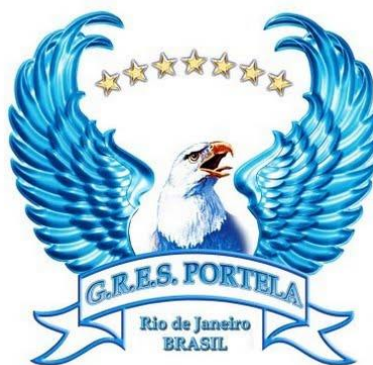
Figura 8: Águia da Portela

É datada em 1968 a primeira vez em que a Portela colocou seu símbolo maior no seu abre-alas, ao desenvolver o enredo “O tronco do Ipê”, baseado no livro de José de Alencar. (SIMAS, 2012)