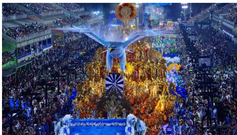
Figura 13: Desfile Campeão da Portela, 2017