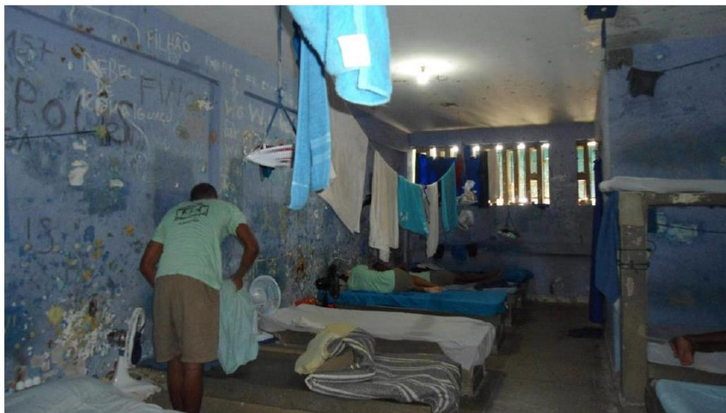
Figura 1: Alojamento em péssimas condições em unidade de internação do DEGASE