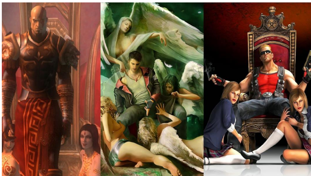
Figura 3 - Representações de mulheres submissas aos homens nos jogos

diferente. Segundo Foster & Eco apud Mungioli (2014), os sujeitos femininos nos jogos são uma espécie de “bonecas vivas”, não possuindo traços de personalidades ou motivações profundas. Um exemplo disso é a personagem do mundo do jogo Super Mario Bros. , no qual sempre é sequestrada e espera a ajuda de um homem, reforçando a ideia de uma “donzela em perigo”. Outro exemplo é a franquia de jogos The Legend of Zelda , no qual a princesa Zelda, que dá nome ao título do jogo, sempre requisita a ajuda de Link para ajudá-la em um problema em seu reino, e você joga somente com ele no jogo. Quando não aparecem nessa situação de perigo, requerindo ajuda de um homem, as personagens femininas aparecem como suporte para os protagonistas homens, ajudando-os na trama dos jogos. A título de exemplo são Ada Wong ( Resident Evil ) e Saria ( The Legend of Zelda ), que seriam imagens fortes de mulheres se não fossem por sua história ser totalmente apoiada nos protagonistas.