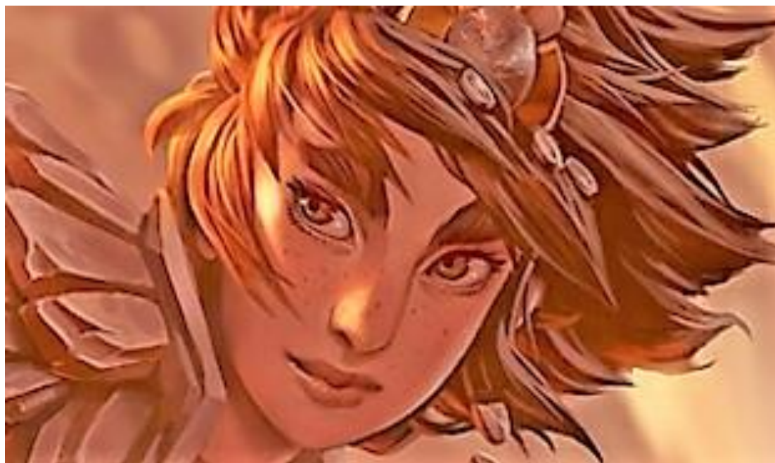
Figura 5 - Design original da personagem 5

ela era feia, que seu nariz era horrível, pois era largo. Teve pessoas que refizeram o designer de wallpaper dela afinando o seu nariz, boca e sobrancelha (HERNANDEZ, 2016).