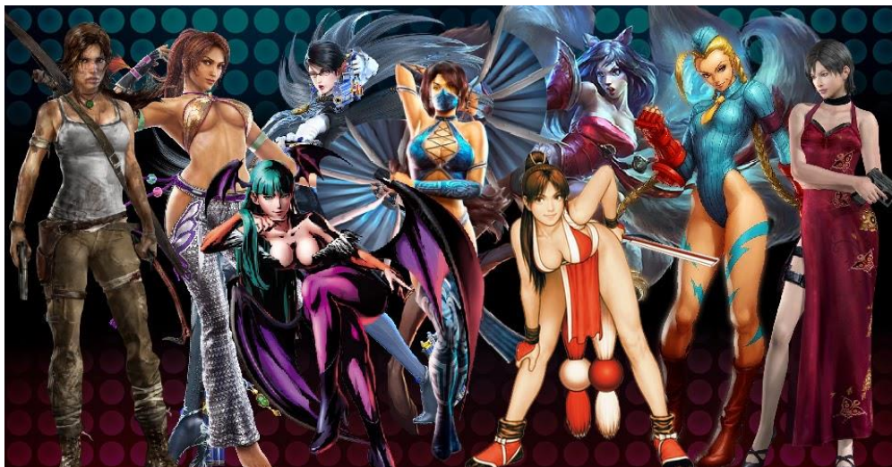
Figura 4 - Exemplo de hipersexualização

O termo “modelo de beleza irreal” faz referência a tipos físicos pouco apropriados para a ação a que as personagens se propunham. Enquanto para personagens homens envolvidos em games de ação, os músculos e combates que compõe o gameplay fazem sentido, para as personagens mulheres, seios grandes ou roupas reveladoras, não são condizentes para o combate, pelo contrário, atrapalham. (p.24)