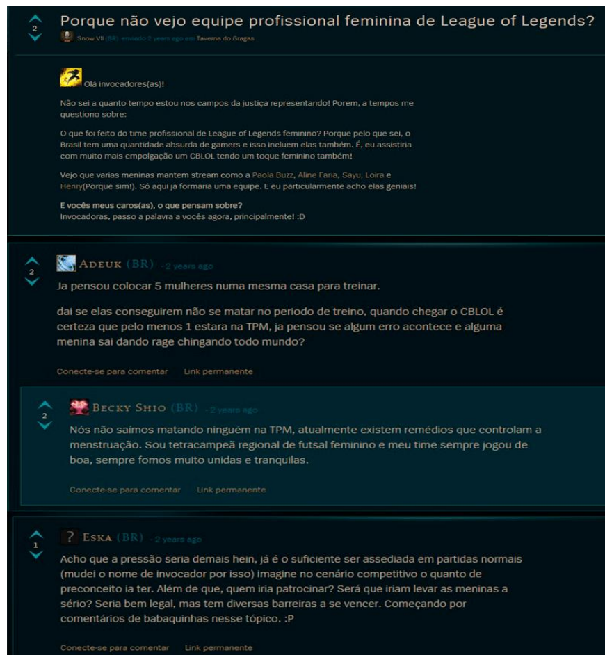
Figura 2 - Comentário sexista num fórum de League of Legends