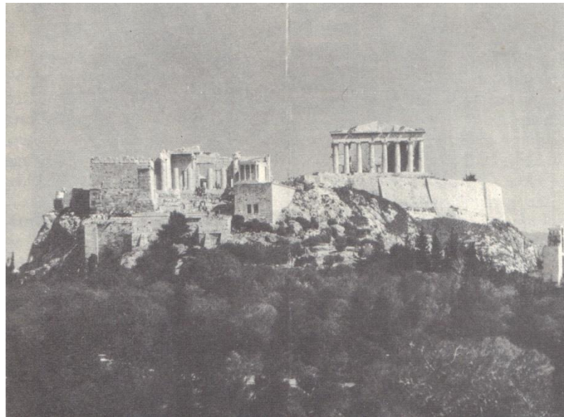
Figura 3 – Ruínas da Ácropole de a Atenas; Fonte: JARDÉ, Auguste. A Grécia antiga e a vida grega . P. 9.

Na composição das cidades-Estados deste período, a religião mitológica influenciava nos espaços institucionais que compunham a cidade. Era presente um teatro, local de representações dos mitos em homenagem ao deus Dioníso. A acrópole, anteriormente usada para palácios e templos, na época clássica, torna-se somente um recinto religioso. Como na acrópole de Atenas, onde a deusa Atena era adorada em todas as suas manifestações 91 (figura 3).