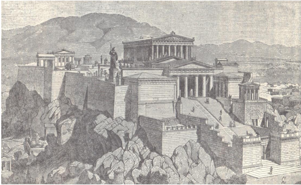
Figura 2 – reconstituição da Acrópole de Atenas.

Judith Crosher diz que por volta do século XII a.C. ocorreram novas invasões de tribos guerreiras vindas do Norte, tomando o Mediterrâneo 55 . Um destes povos guerreiros, os dórios , devastaram cidades micênicas, ocasionando na transferência da população local atacada para a Anatólia, Eólia e a Jônia. Como resultado, formou-se um misto de súditos dos reis micênicos, com os dórios e os seus súditos anteriores 56 .