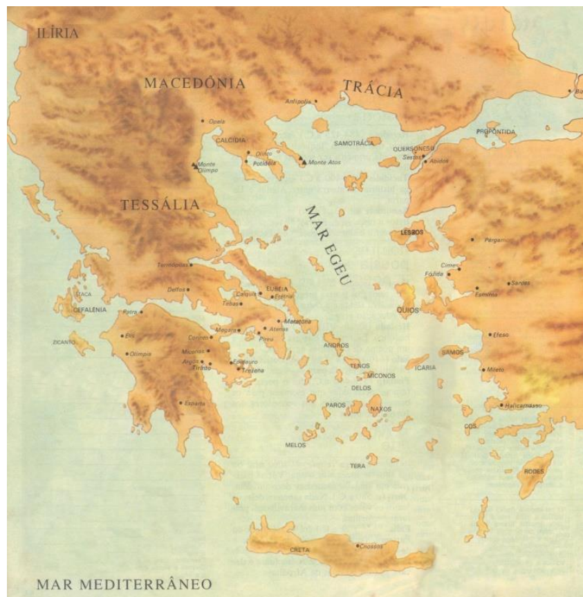
Figura 1 - Mapa da Grécia antiga

De acordo com pesquisas arqueológicas, a sociedade grega se originou de populações vindas da Trácia, da Ilíria e da Anatólia 47 , que passaram a ocupar o sul da península Balcânica, do outro lado do mar Egeu, a região de Troia, as ilhas Cíclades e a ilha de Creta 48 (figura 1). Aproximaram-se do povo nativo e estabeleceram colônias e feitorias 49 , originando o povo heleno , conhecido pelos latinos como grego.