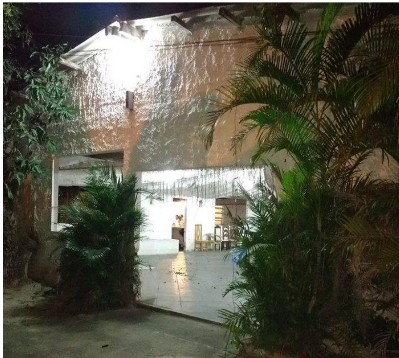
Foto da porta do Ilê Asé Irin Todé