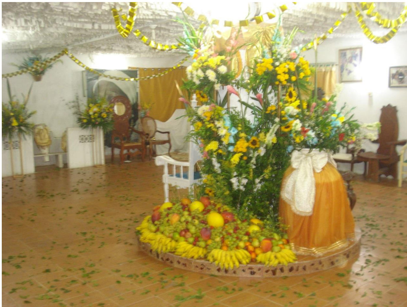
Foto do Asé Ya Nassô Oká Ile Osun-Sociedade Nossa Senhora das Candeias.