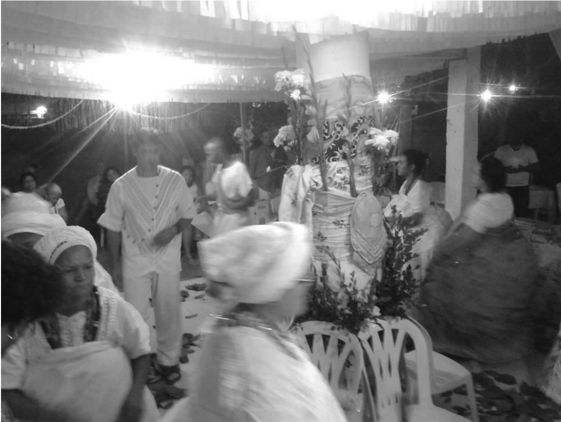
Foto do Ilê Asé Bábà mi Ògún Onipim em momento de festa.