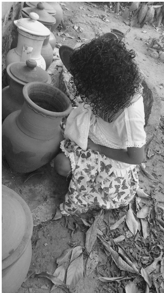
Foto da yawô de Osumaré (OmoloDan) no espaço dos banhos de erva no ILÊ ASÈ BÁBÀ MI ÓGÙN ONIPIM.

Dentro do terreno da roça, ainda tem o espaço das ervas e dos banhos ritualísticos do terreiro; os espaços de cozinha, quartos de dormir, quarto de roupas e espaços de culminâncias.