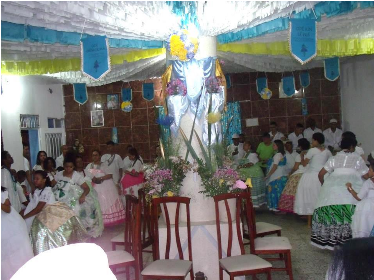
Foto da Sociedade São Miguel Arcanjo em momento de festa.