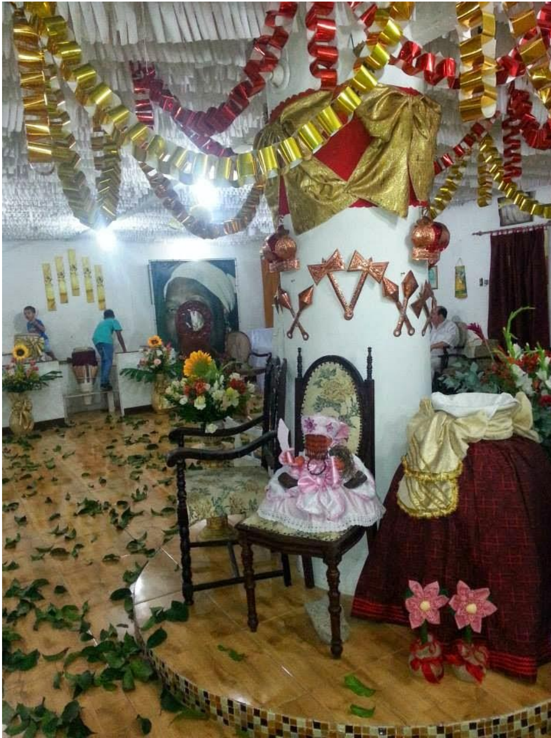
Foto do Asé Ya Nassô Oká Ile Osun-Sociedade Nossa Senhora das Candeias.