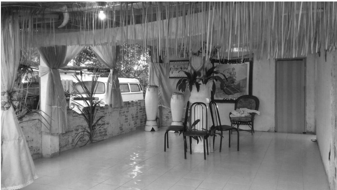
Foto do Ilê Asé Bábà mi Ògún Onipim