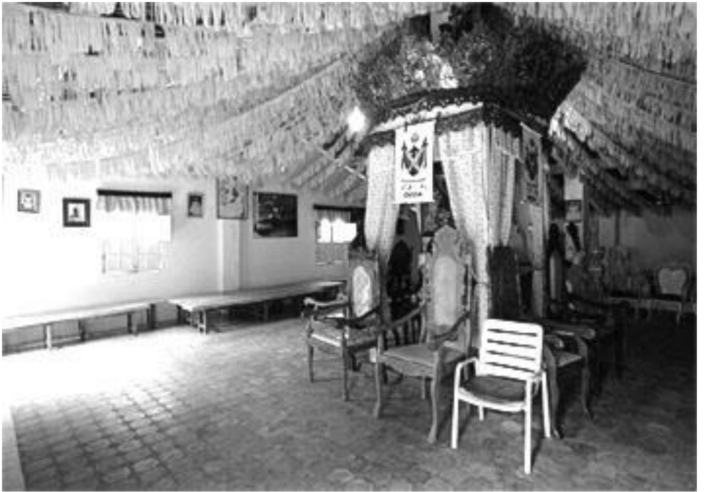
Foto do interior da Casa Branca de Engenho Velho.