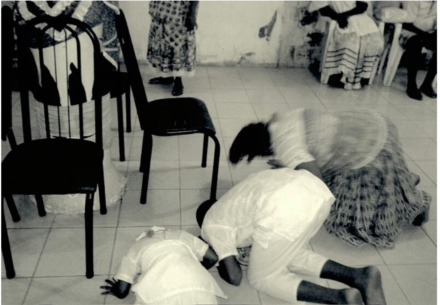
Filhos de santo do ILÊ ASÈ BÁBÀ MI ÓGÙN ONIPIM. Foto tirado por Henrique Azevedo em 29/05/2015