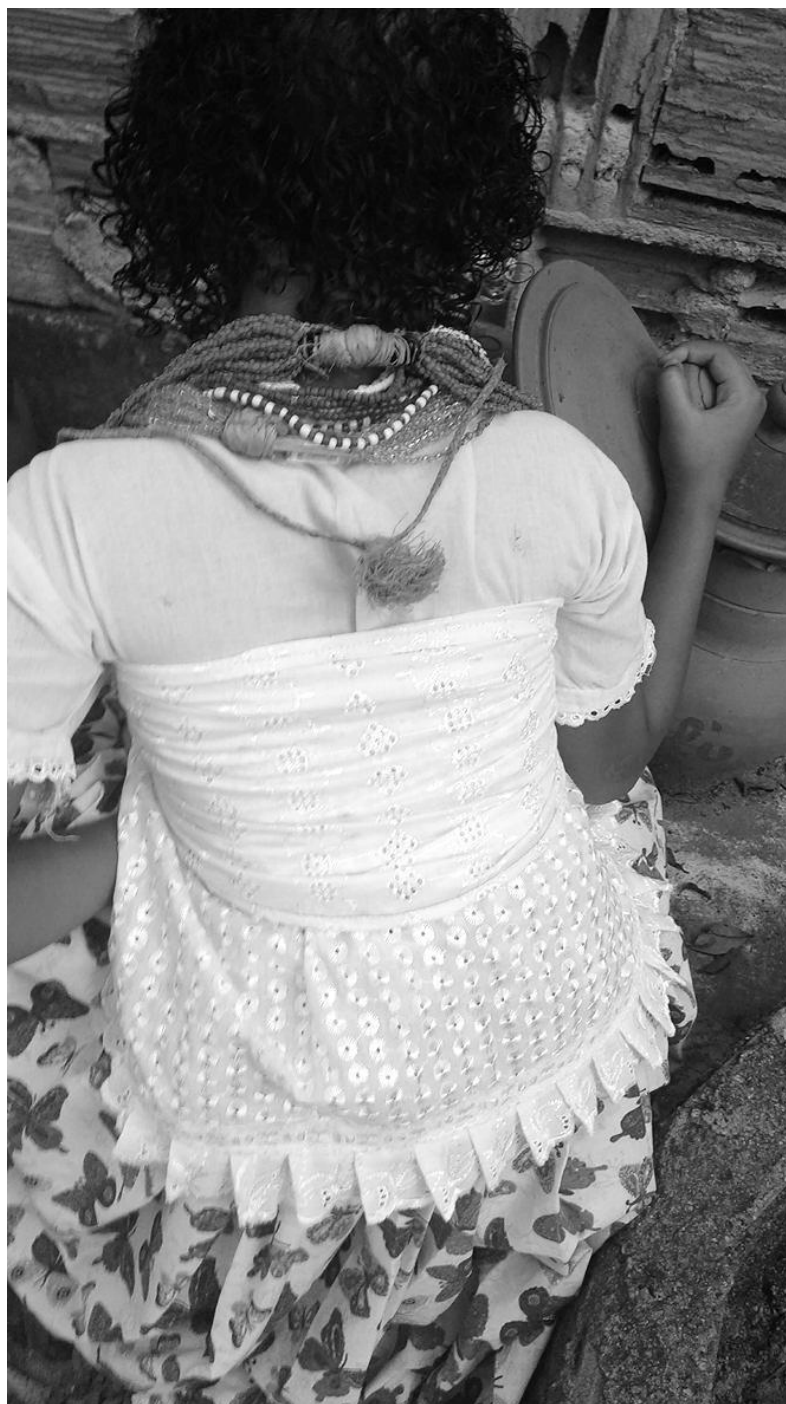
Foto da yawô de Osumaré (OmoloDan) PEGANDO O Abô (banho de erva) ILÊ ASÈ BÁBÀ MI ÓGÙN ONIPIM.