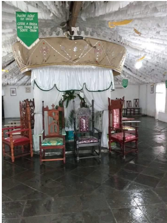
Foto do interior do Ilê Asé Irin Todé