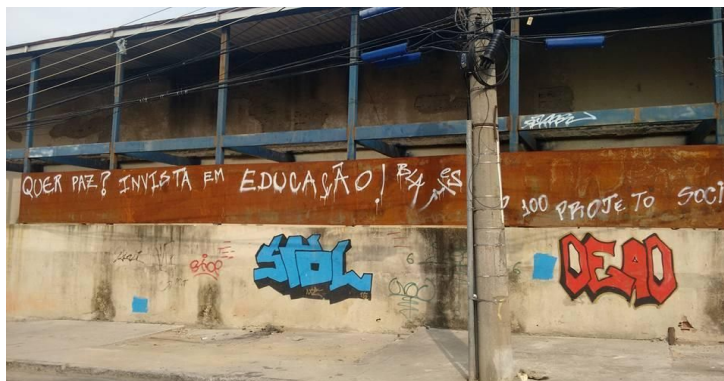
Figura 2 – Pichação BLA sobre educação