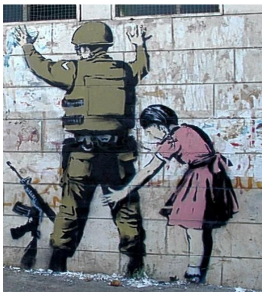
Figura 4 – Grafite de Banksy

Ao explorar o documentário Exit Through The Gift Shop podemos conhecer melhor o início do movimento conhecido como grafite, uma arte proibida e praticada exclusivamente nas ruas. O documentário Exit Through The Gift Shop também nos apresenta dois tipos de grafiteiros, um que participa do movimento com o intuito de protestar e de confrontar o governo e um outro que apenas quer ser denominado um artista e ganhar dinheiro. O primeiro grafiteiro é conhecido como Banksy, um grafiteiro que se destaca dentro do universo do grafite. Banksy, como é exposto no documentário Exit Through The Gift Shop, possui um estilo irreverente e utiliza o grafite para protestar e chamar atenção do mundo para questões importantes.