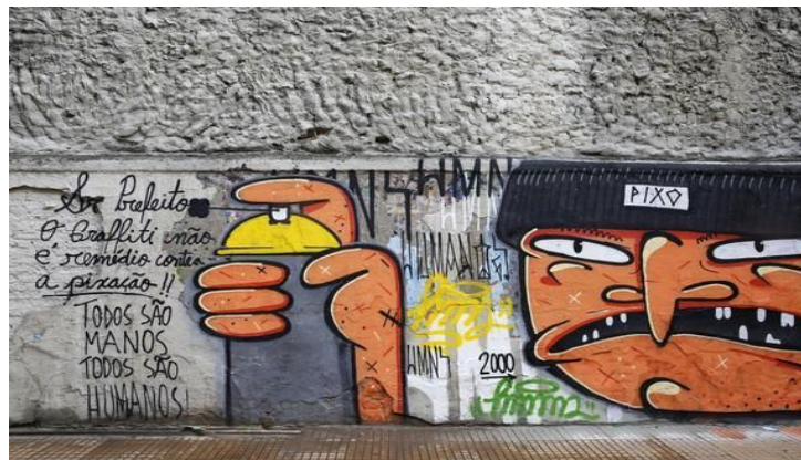
Figura 8 – União grafite e pichação contra medidas do Prefeito Doria

Assim como na pichação, São Paulo também é referência dentro do cenário do grafite, vide que foi lá que, no final da década de 70, o grafite chegou ao Brasil. A cidade de São Paulo possuía o maior mural a céu aberto de grafites da América Latina, até começar a gestão do prefeito Dória que declarou guerra a pichação mas acabou sobrando também para o grafite. Após iniciadas as ações contra o movimento pichação, atores de ambos os movimentos se posicionaram contra as medidas adotadas pelo prefeito.