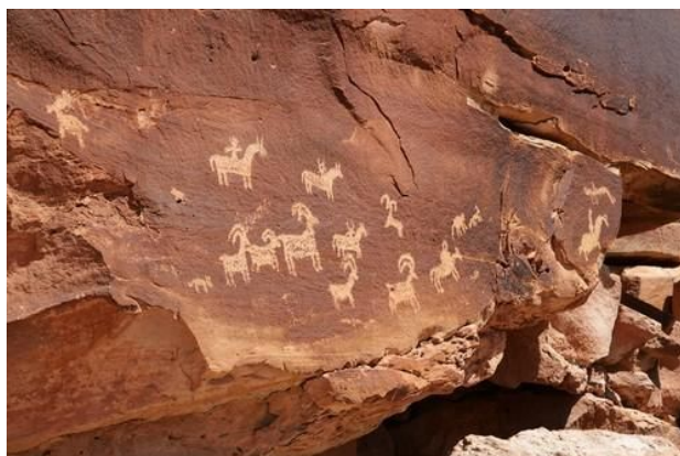
Figura 1 – Arte Rupestre