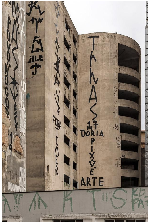
Figura 9 – Pichação contra o prefeito Doria