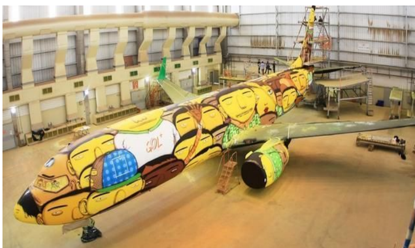
Figura 6 – Os Gêmeos e o avião da Seleção

Ao mesmo tempo que o grafite vem ganhando mais reconhecimento perante a sociedade, a pichação vem sendo cada vez mais discriminada. A sociedade a trata como uma arte transgressora, irrelevante e sem beleza, sem levar em conta que ambos são movimentos que estão interligados, vide que grande parte dos grafiteiros de hoje começaram como pichadores.