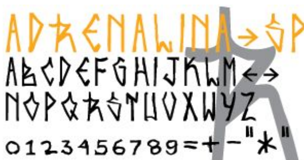
Figura 7 – Alfabeto pichação São Paulo

Dentro dos universos da pichação e do grafite, a capital brasileira que mais se destaca é São Paulo. A capital possui na pichação um estilo único, a caligrafia dos pichadores de São Paulo usa como base letras que lembram os letreiros de bandas de rock.