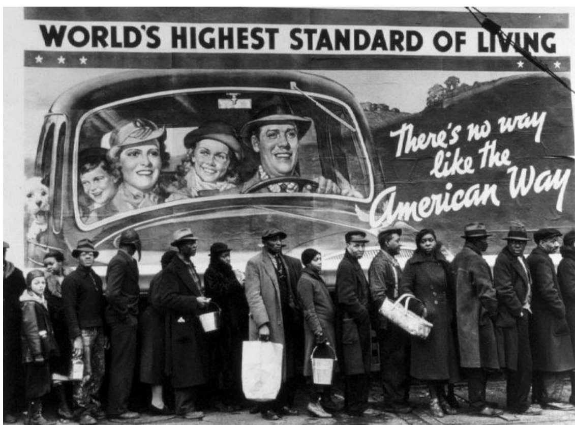
Figura 1: fila de desempregados em frente a um outdoor que faz alusão ao ‘american way of life’, o melhor padrão de vida mundial.

“Enquanto se multiplicavam as falências e demissões, o pânico monetário e financeiro e as bancarrotas estatais, o primeiro plano da cena era ocupado por peritos governamentais e encontros diplomáticos. [...] milhões de pessoas se viam sem emprego, portanto sem recursos e sem dignidade, na maioria das vezes sem proteção social, incapazes de pagar seus aluguéis, reduzidas à espera das distribuições gratuitas de alimentos e agasalhos, levadas ao despejo, à mendicidade, à revolta.” (GAZIER, 2010, p. 7).