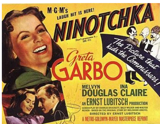
Figura 5: Cartaz do filme Ninotchka (1939), de Ernst Lubitsch.

(briga pela hegemonia ideológica mundial entre os EUA e a URSS no período entre 1945 e 1989).