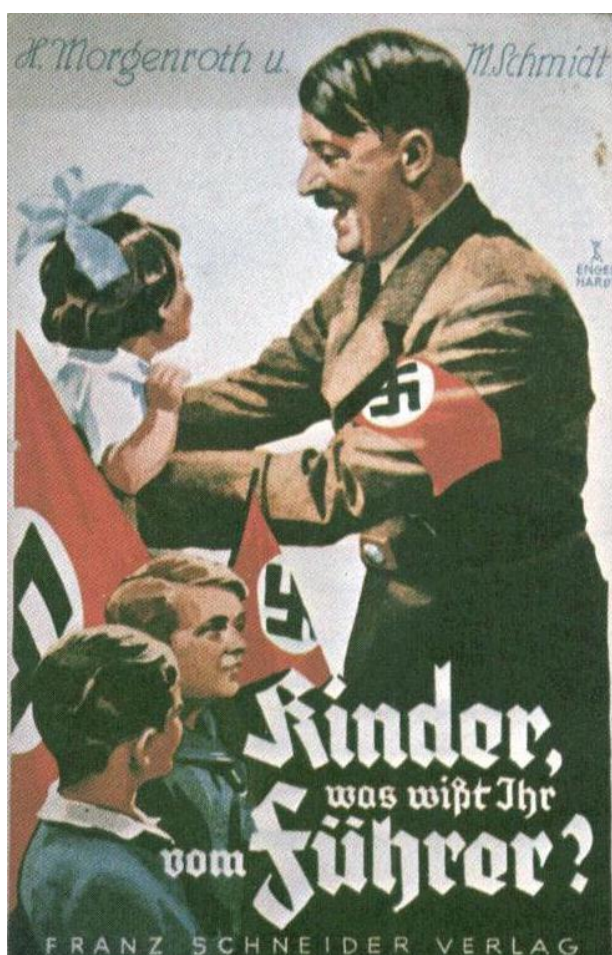
Figura 4: “Crianças, o que vocês sabem sobre o Führer?”

Como analisa Le Bon Freud (apud, 2013, p.47),