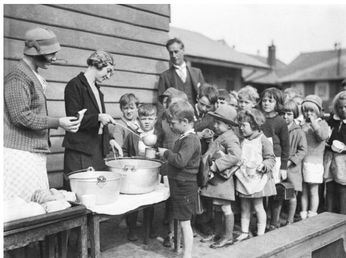
Figura 3: fila de crianças para receberem comida.

Uma mudança de estado de espírito se manifesta em toda a parte à medida que a provação se prolonga: em alguns meses, o desempregado passa da procura febril ao desânimo e depois à apatia, abatimento final daquele que perdeu todo o amor-próprio e evita os contatos sociais com humilhação profunda e ansiosa.