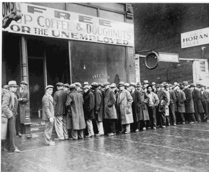
Figura 2: desempregados formam fila para sopa e café grátis.

Ainda nos primeiros anos da Depressão não havia seguro-desemprego, o que restava era a caridade. O número de despejos se multiplicava a cada dia, lotando os abrigos e fazendo surgir muitas moradias improvisadas, casebres amontoados em terrenos abandonados, cuja concentração foi aos poucos formando verdadeiras favelas dos “excluídos” (Coggiola, 2009).