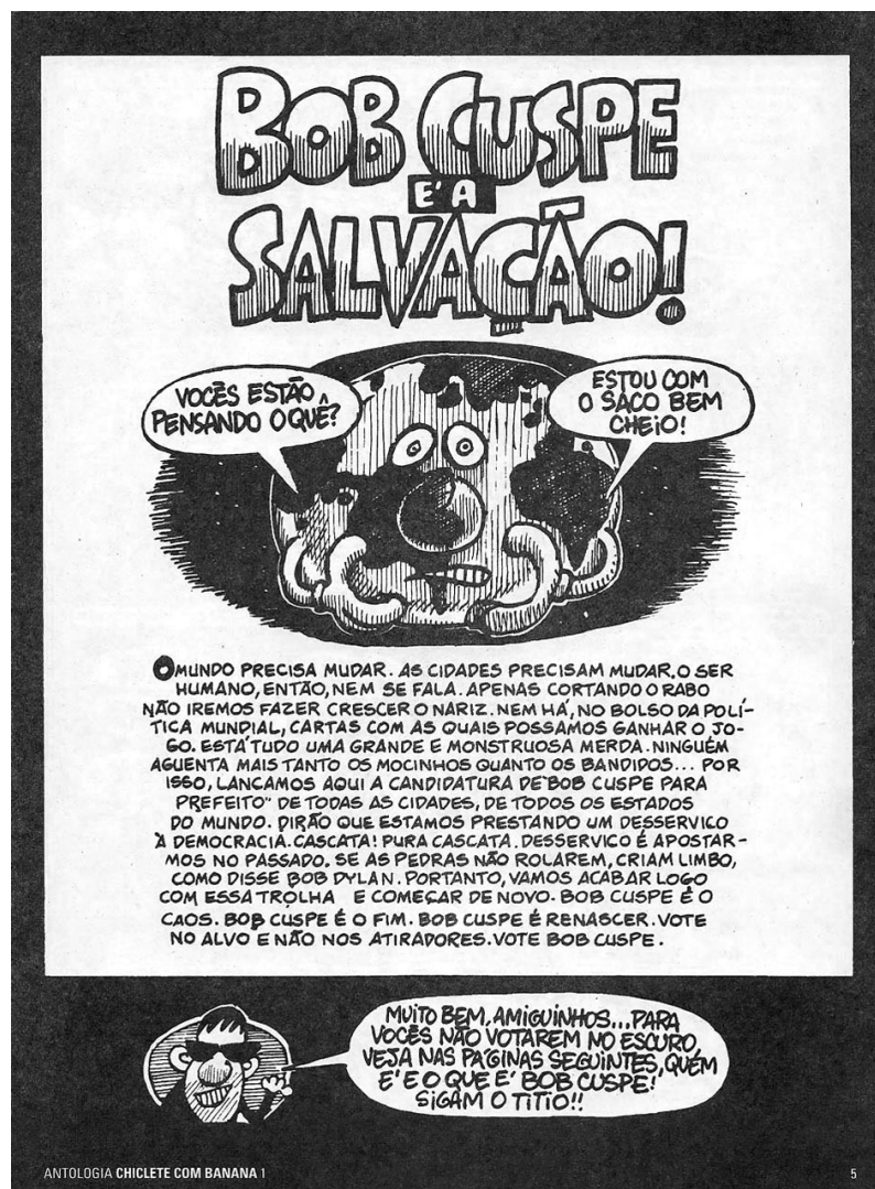
Ilustração 6 – Página 5 da Antologia Chiclete com Banana 1.

Na primeira edição da Antologia da Revista Chiclete com Banana publicada pela editora Devir, encontra-se o início da trajetória de Bob Cuspe. A história, iniciada na página 5, cuja qual a personagem é protagonista apresenta como título os seguintes dizeres: “Bob Cuspe é a salvação!”. Vale frisar que a edição original da revista Chiclete com Banana que contém a história foi a de número 1 publicada no ano de 1985.