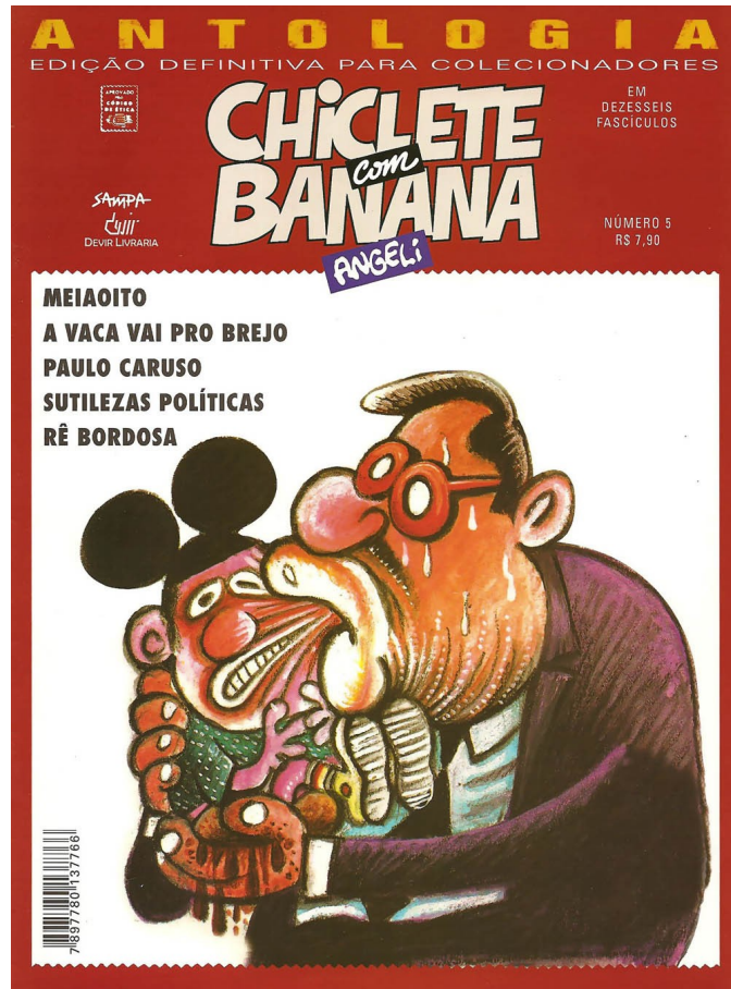
Ilustração 1 – Capa da Antologia Chiclete com Banana 5.

A figura do político representado pelo cartunista se encontra numa situação embaraçosa e um tanto quanto sem saída, pois a criança em seu colo apresenta uma reação não esperada pela personagem do político e muito menos pelos receptores da imagem.