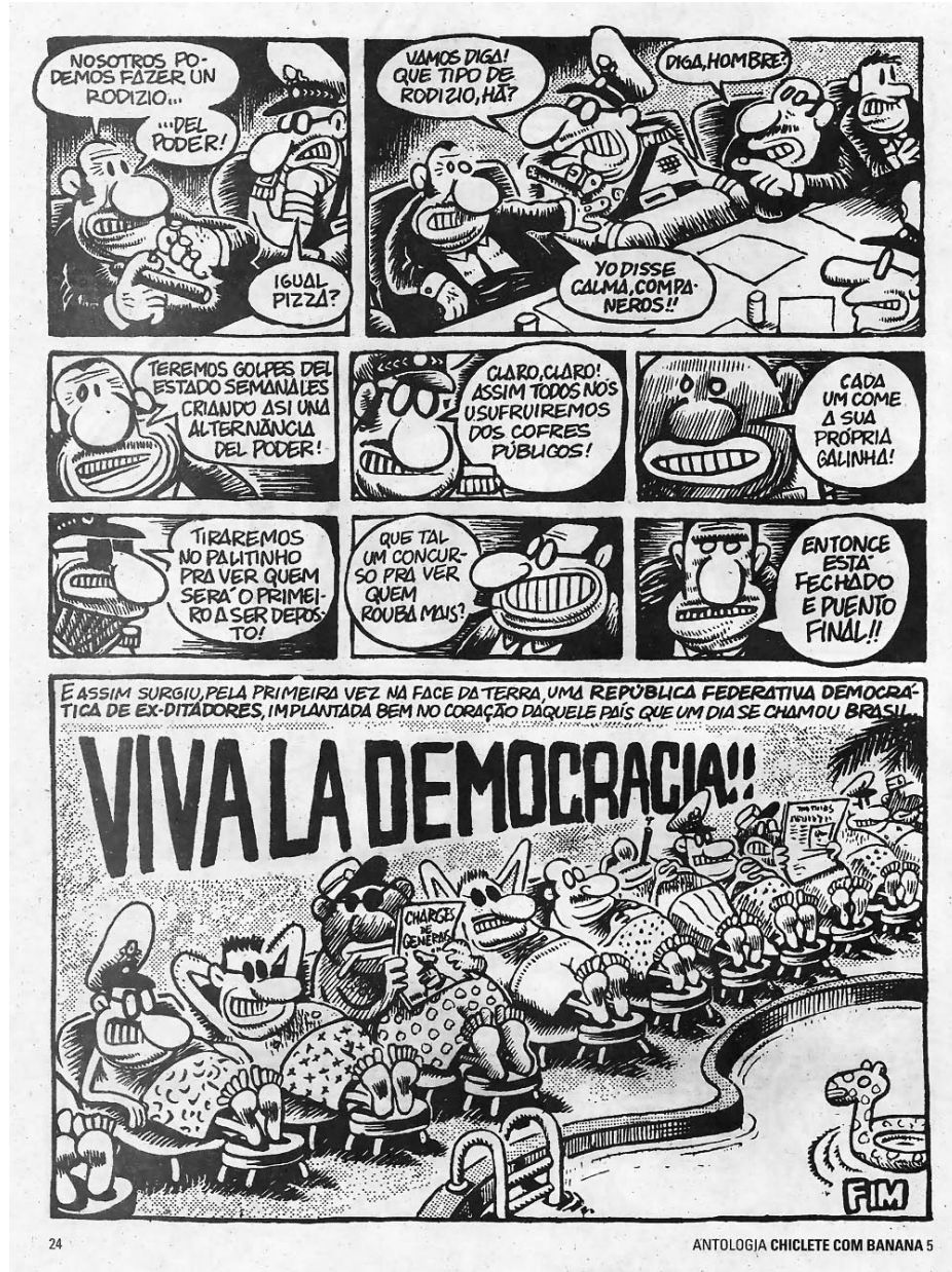
Ilustração 5 – Página 24 da Antologia Chiclete com Banana 5.