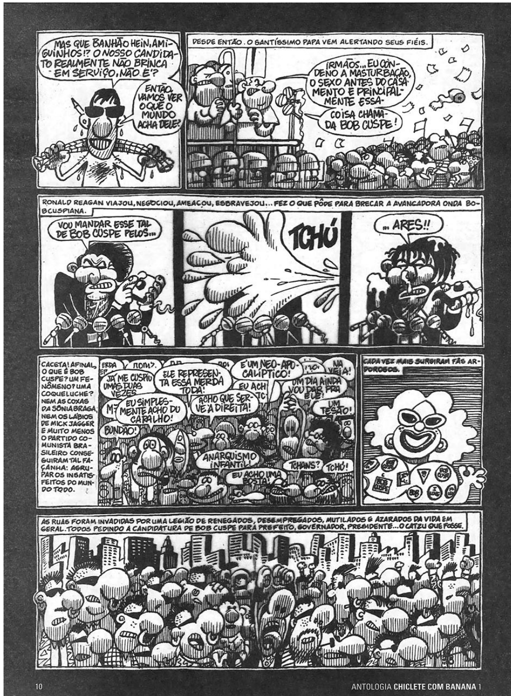
Ilustração 10 – Página 10 da Antologia Chiclete com Banana 1.

As tiras apresentadas na página 11 trazem a representação de diferentes tipos sociais e suas respectivas formas de atuação social e política. No primeiro quadro da página, o autor retrata a si mesmo como também parte da história e, dessa forma, também como um ator social.