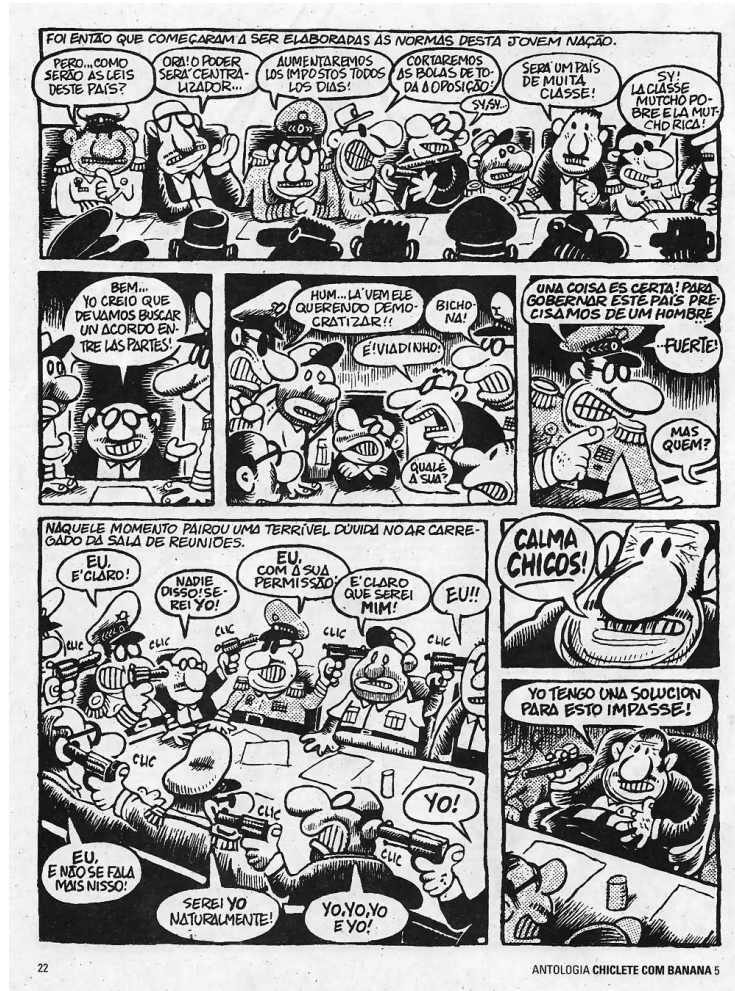
Ilustração 4 – Página 22 da Antologia Chiclete com Banana 5.

No primeiro quadro da página 22, as leis e normas da nação começaram a ser pensadas e moldadas aos interesses do grupo que se encontrava no poder. As leis que são citadas pelos militares nas tiras refletiam a situação do país da década de 1980, sob os moldes de uma estrutura de sociedade conservadora.