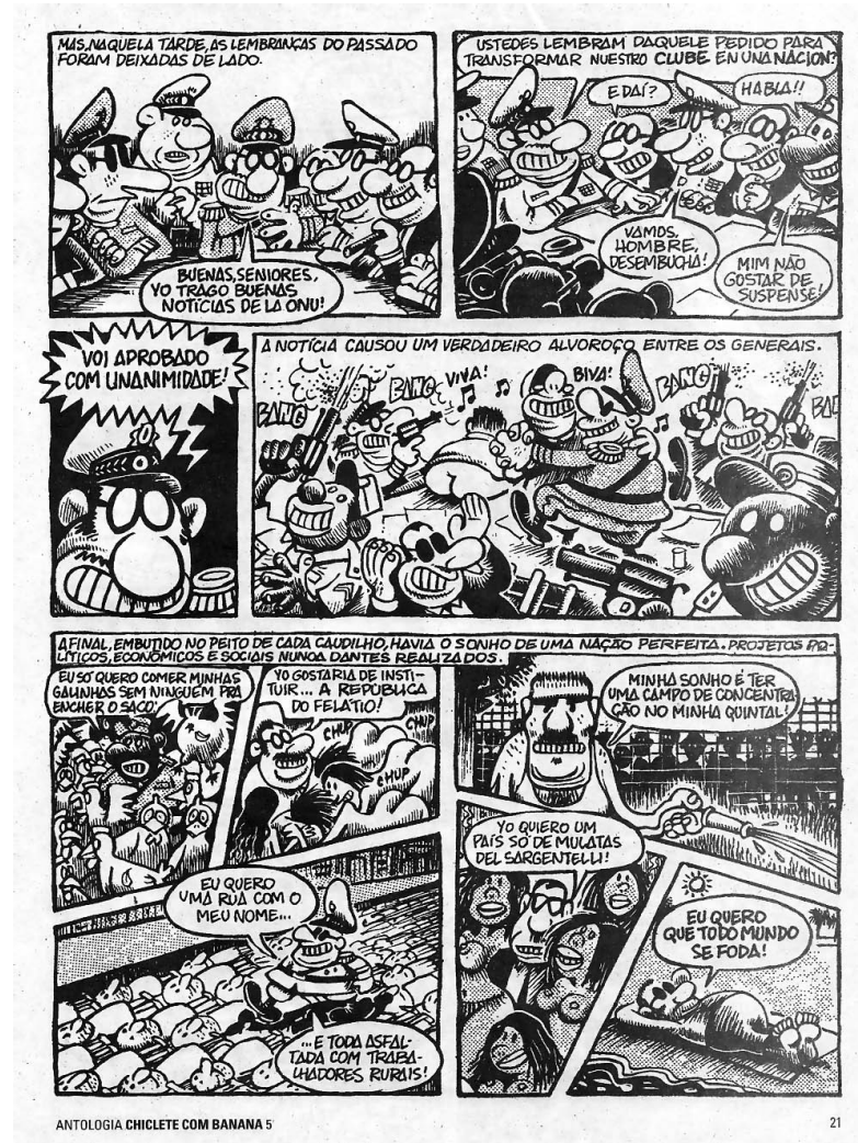
Ilustração 3 – Página 21 da Antologia Chiclete com Banana 5.

Nos últimos quadros da página 20 a figura do militar recebe uma ligação da ONU trazendo boas notícias, pelo menos ao grupo de ditadores. Na página seguinte há o desenrolar da situação.