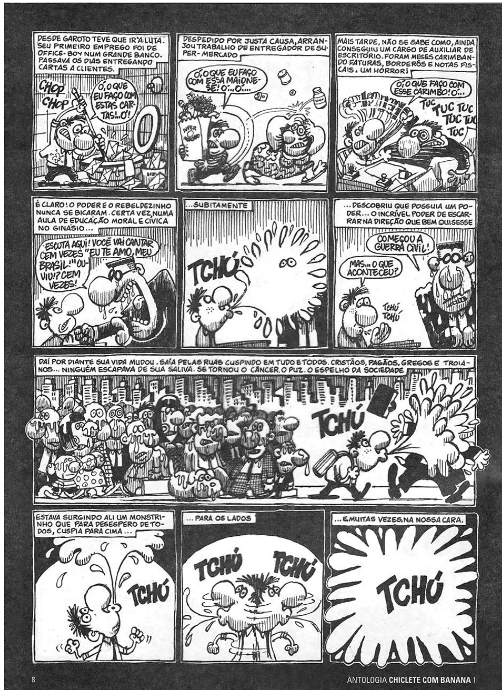
Ilustração 8 – Página 8 da Antologia Chiclete com Banana 1.

A música da banda Ultraje a Rigor cantada por Bob Cuspe na página 9 representa o fato de que boa parte da população não era capaz de pensar criticamente a sociedade e as estruturas que a sustentam. Tal fato acarreta em escolhas políticas equivocadas, o povo em sua maioria acaba fazendo a escolha desejada por uma minoria ao deixarem ser influenciados.