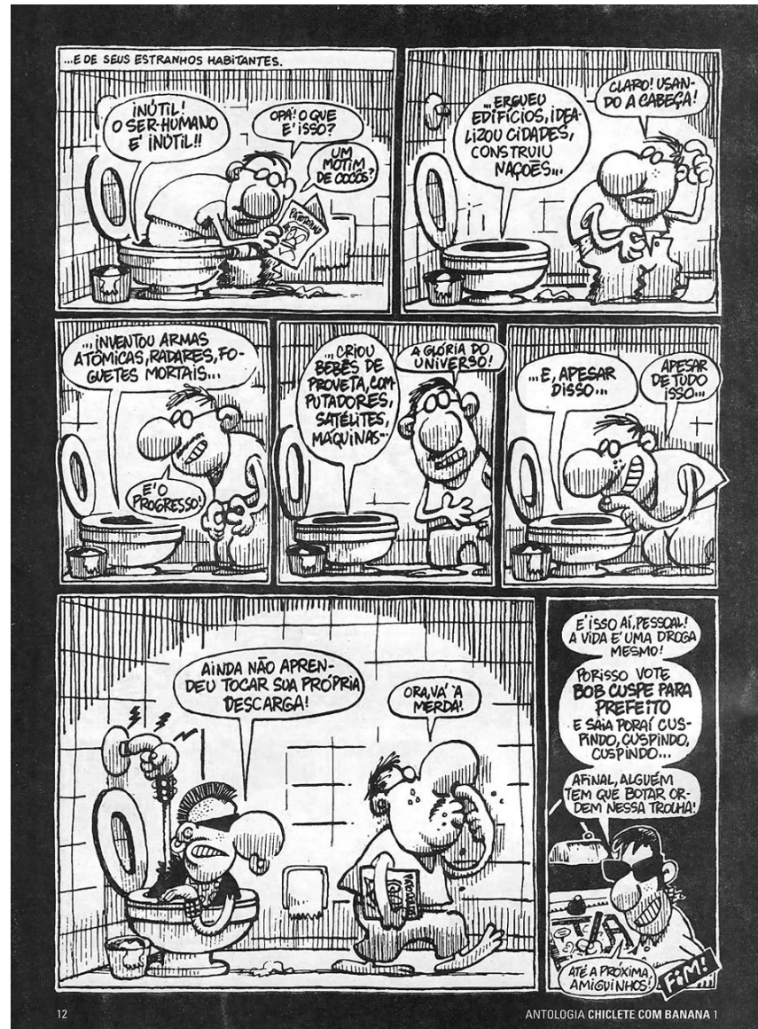
Ilustração 12 – Página 12 da Antologia Chiclete com Banana 1. Fonte: Antologia Chiclete com Banana volume 1.

A conduta tradicional com a qual foi conduzida abertura política reflete num conservadorismo social e certo acomodamento por parte da sociedade civil. O fato de a personagem não ser capaz nem de dar descarga pode refletir uma falta de posicionamento crítico e político, sendo um cidadão passivo das decisões tomadas no meio social.