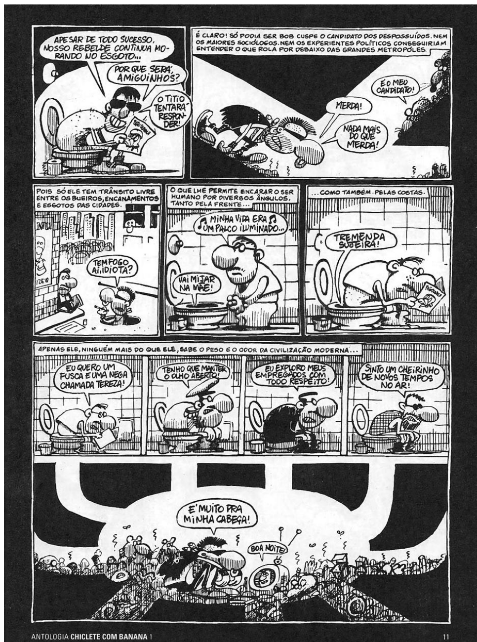
Ilustração 11 – Página 11 da Antologia Chiclete com Banana 1. Fonte: Antologia Chiclete com Banana volume 1.

O fato de Bob Cuspe viver nos esgotos e encanamentos lhe permite um conhecimento maior do ser humano. Pode-se assim estabelecer uma comparação entre a personagem e, não apenas o cartunista, a sociedade. Ao elaborar críticas a respeito do meio em que se vive, é possível entender os sujeitos que compõem o meio social e sua relação com o âmbito político.