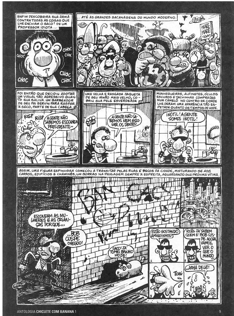
Ilustração 9 – Página 9 da Antologia Chiclete com Banana 1.

Fonte: Antologia Chiclete com Banana volume 1.