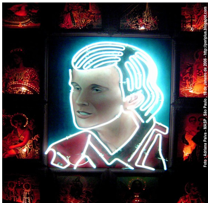
Figura 5 – Adoração (Altar para Roberto Carlos)