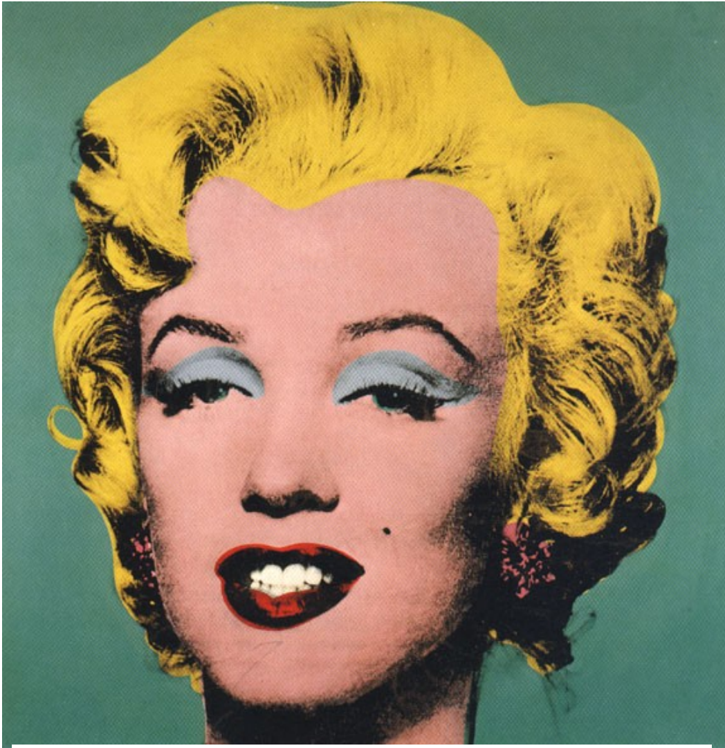
Figura 1 – Marilyn

Para exemplificar o parágrafo anterior, utilizaremos a obra Marilyn , de 1964, e a obra Campbell's Soup Can , de 1962.