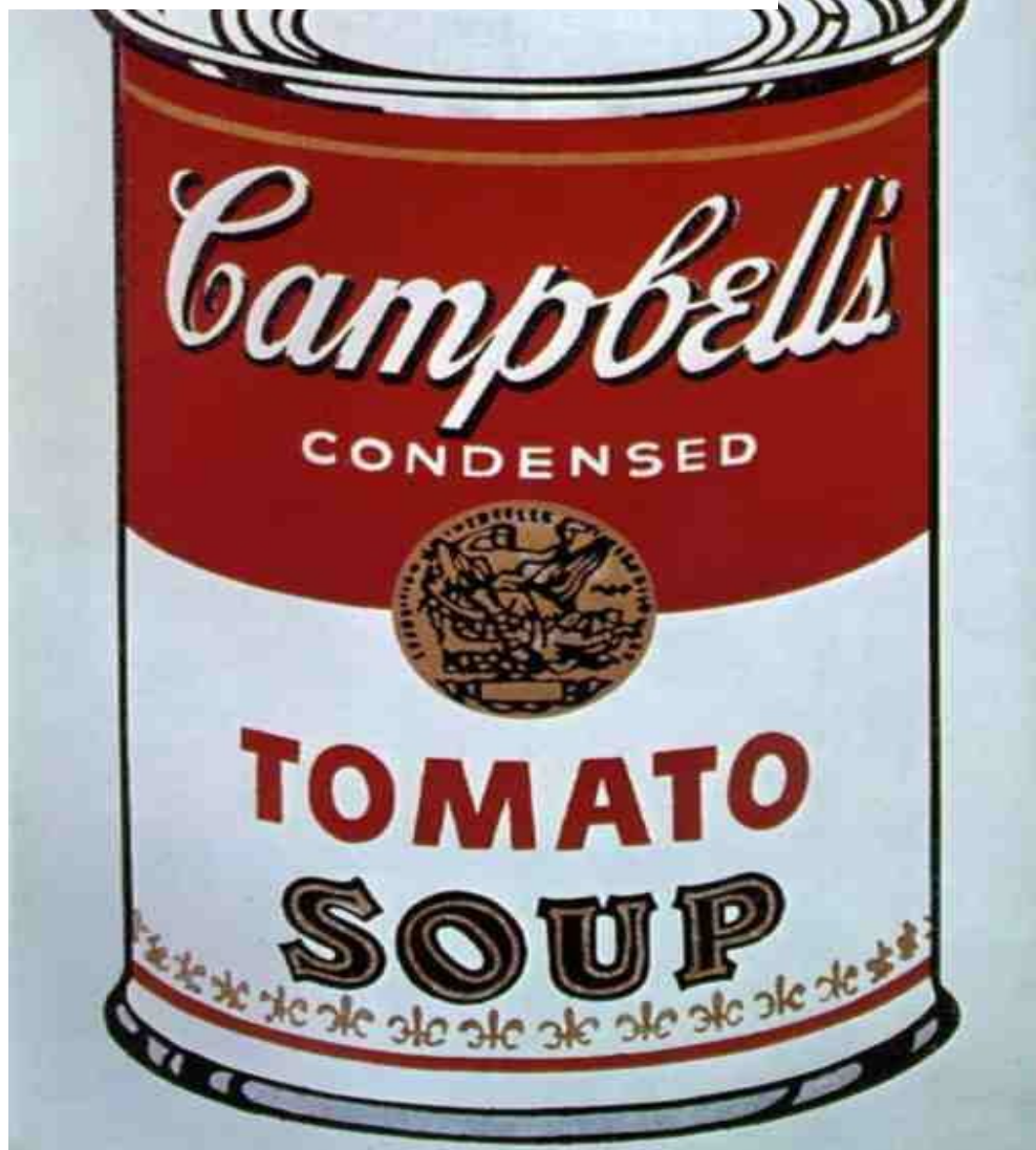
Figura 3 – Campbell's Soup Can (Tomato)