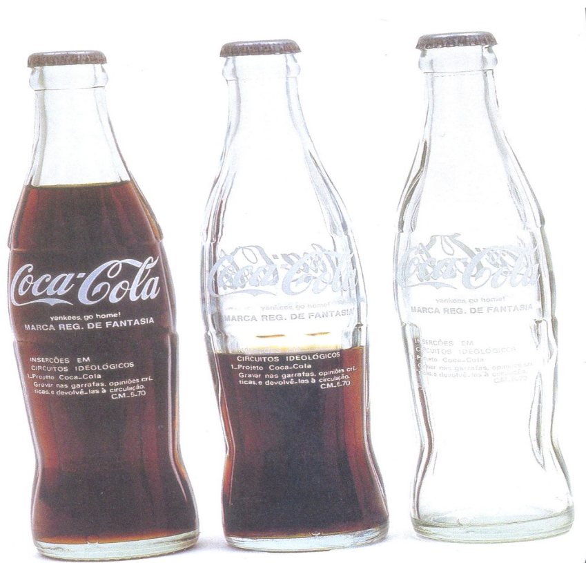
Figura 6 – Inserções em Circuitos Ideológicos: Projeto Coca – Cola

É nesse contexto sociopolítico que Cildo Meireles apresenta uma de suas obras mais emblemáticas, Inserções em Circuitos Ideológicos: Projeto Coca - Cola , de 1970.