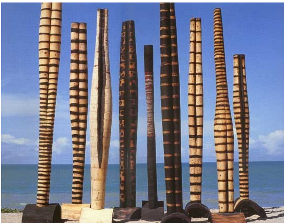
ANEXO 6: [Sem Título] Escultura da série Totem