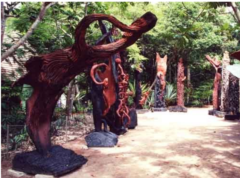
ANEXO 8: Sem Título - Escultura da série Lianas