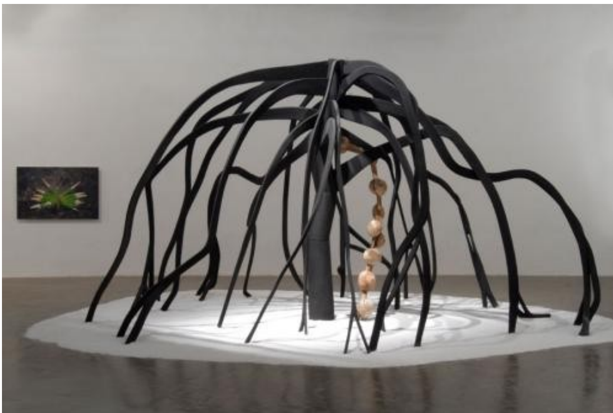
(Imagem 4 - Obra de Frans Krajcberg, nomeada Flor do Mangue , Exposta no MAM)

Para além do pensamento de destruição, as obras de Frans Krajcberg são modelagens que tentam transformar destruição em arte e mostrar que há algo para se notar onde havia apenas destruição. O artista tenta chamar a atenção daqueles que observam suas obras para refletir sobre como é feito aquele objeto e porque foi colocado daquela forma. O artista deseja que seu observador reflita sobre a obra. Mas será que isso é alcançado?