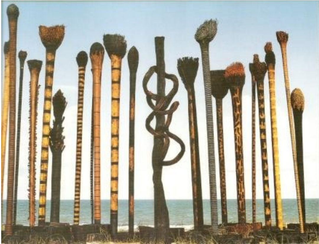
ANEXO 7: Sem Título - Escultura da série Troncos Escultados