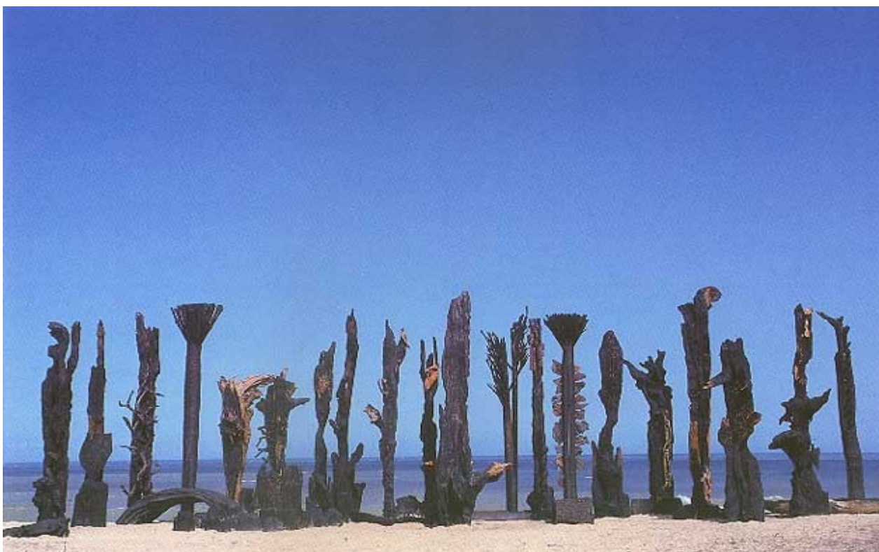
(Imagem 3 - Obra de Frans Krajcberg, Bois calcinés & mineral , 1989 - 1990 - Escultura da série Madeiras Calcinadas)

lembram as cinzas e as queimadas, conforme as cores vão clareando é possível pensar que há o aparecimento de vida, a vida não foi totalmente destruída. O chão repleto de pedras e pedaços de carvão pode ser visto como a morte do solo e os botões nos topos representa o ciclo da vida, que onde havia vida haverá várias outras novas, mesmo onde o solo não é mais propício a isso, pois elas estão acima da destruição. Vida e morte se entrelaçam na obra, tal como os galhos se entrelaçam.