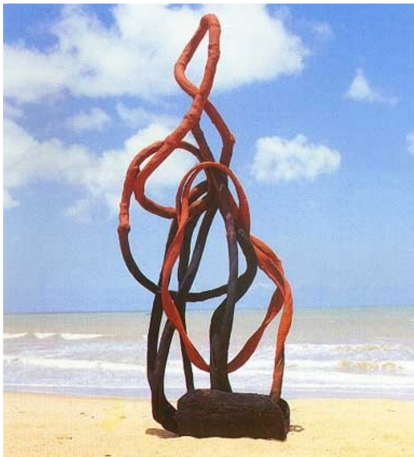
(Imagem 1 - Escultura de Frans Krajcberg da série Lianas, Sem Título)

transformando os cipós, troncos e pedras em obras-manifestos, tentando assim expor ao mundo sua luta pela conscientização da necessidade de preservar o meio ambiente, como é possível notar em algumas obras que serão analisadas a seguir.