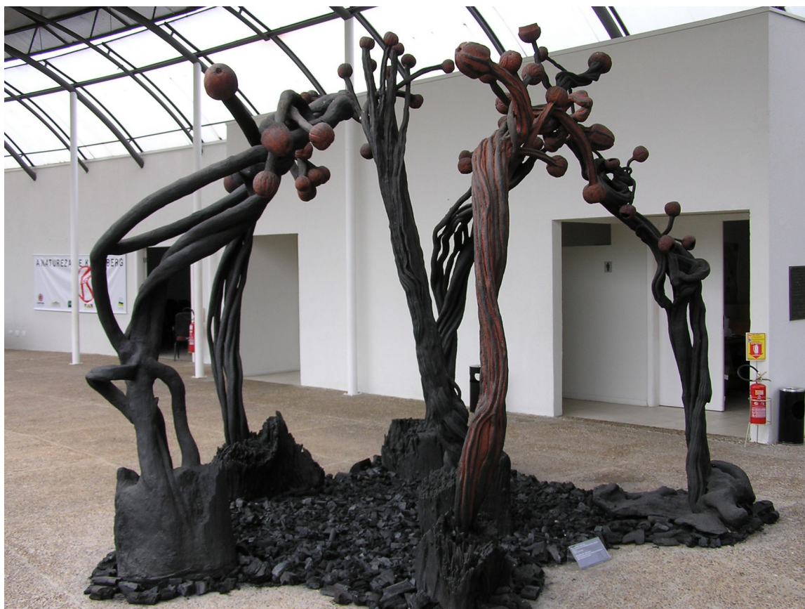
(Imagem 2 - Obra de Frans Krajcberg no Jardim Botânico de Curitiba, 2003).

Percebe-se que se trata de uma obra de grande porte e composta por diversos elementos. Sua base é feita por pedras e pedaços de carvão, há a presença de troncos queimados servindo como suporte para os galhos que foram moldados pelo artista para terem aparentemente um formato semelhante aos galhos das árvores encontradas na Floresta Amazônica, local de inspiração do artista. Há também cabaças colocadas nas partes superiores da obra de vários formatos.