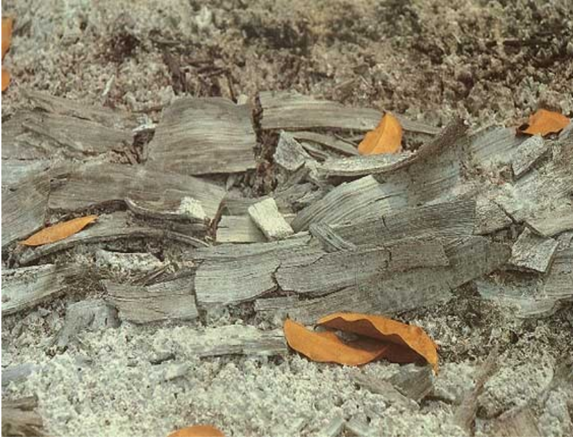
ANEXO 3: [Sem Título] - Fotografia da série Revoltas