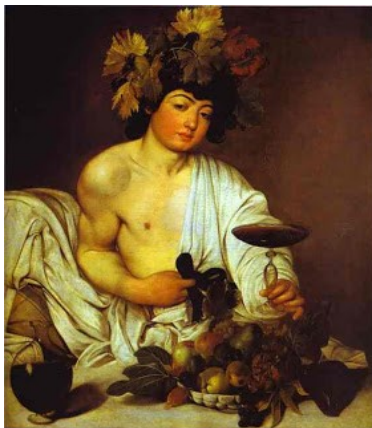
Figura 03: referente ao Deus Baco

Fonte: André Benjamin. Baco (Deus versus demônio)