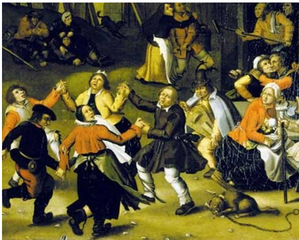
Figura 04: referente ao carnaval cristão

Fonte: Fernando Fernandes. Do Cristianismo medieval à Iemanjá carioca