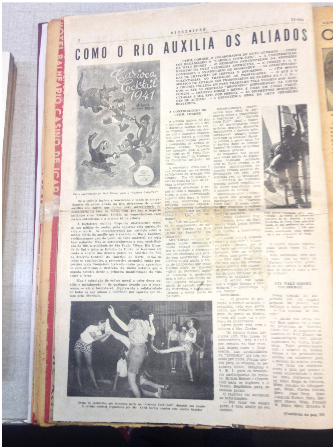
Figura 2 - "Como o Rio auxilia os Aliados".