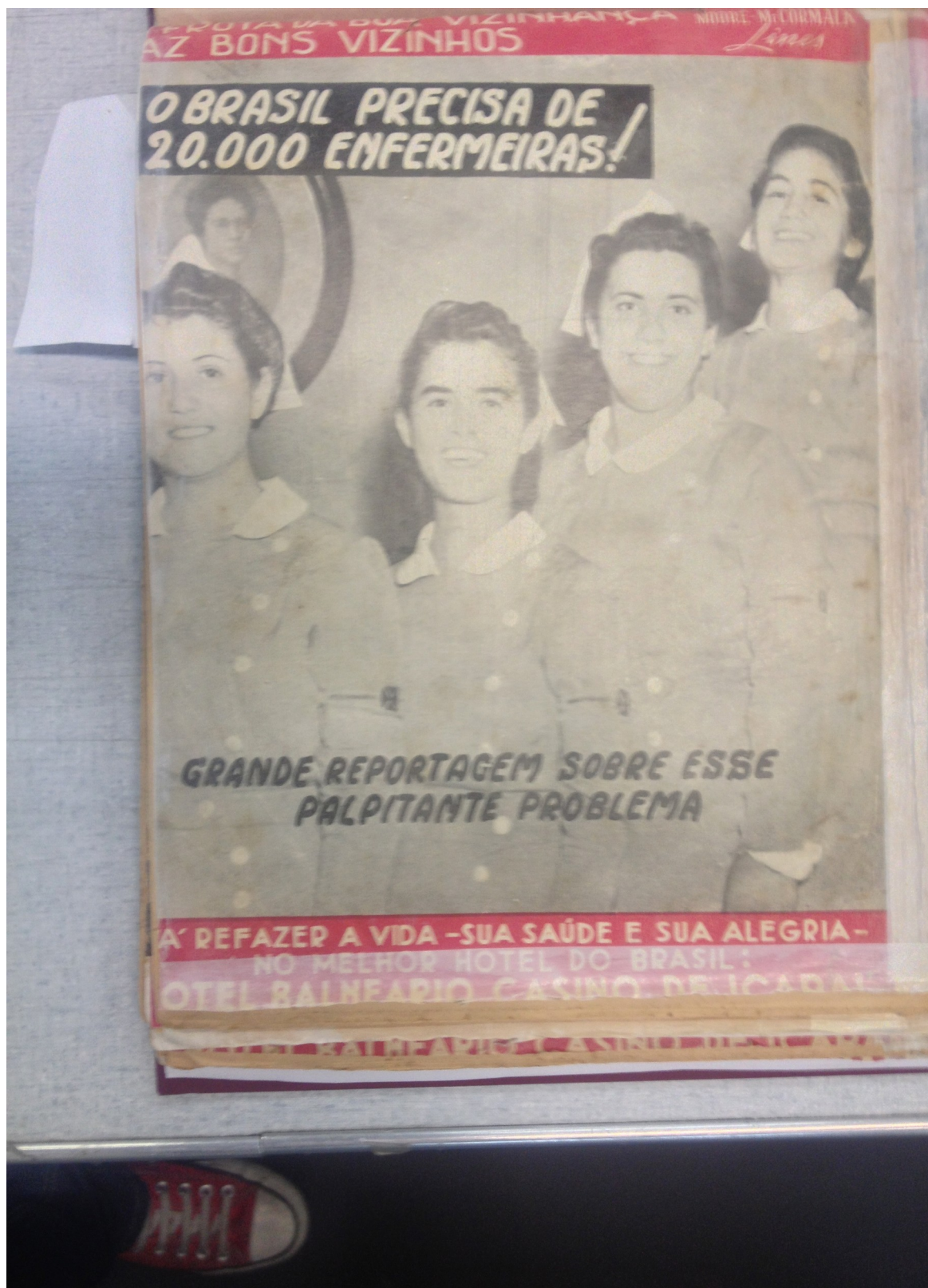
Figura 5 - "O Brasil precisa de 20.000 enfermeiras!"