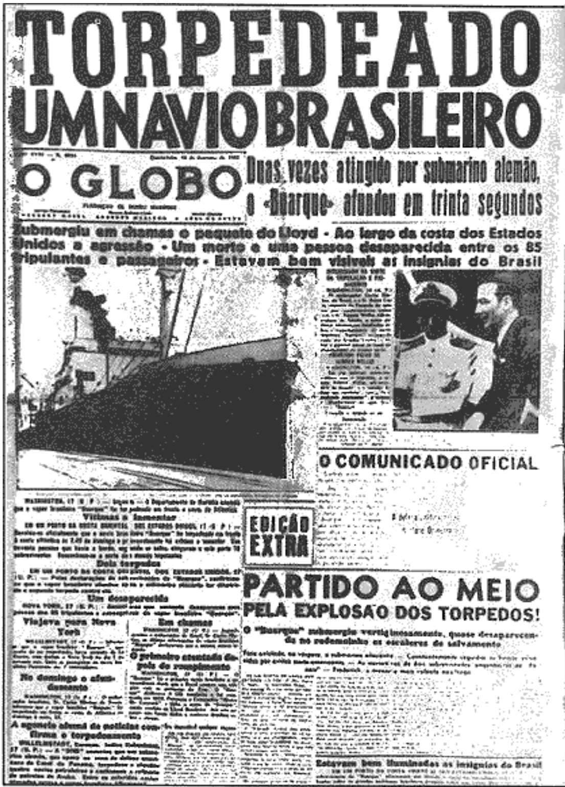
Figura 3 - "Torpedeado um navio brasileiro".