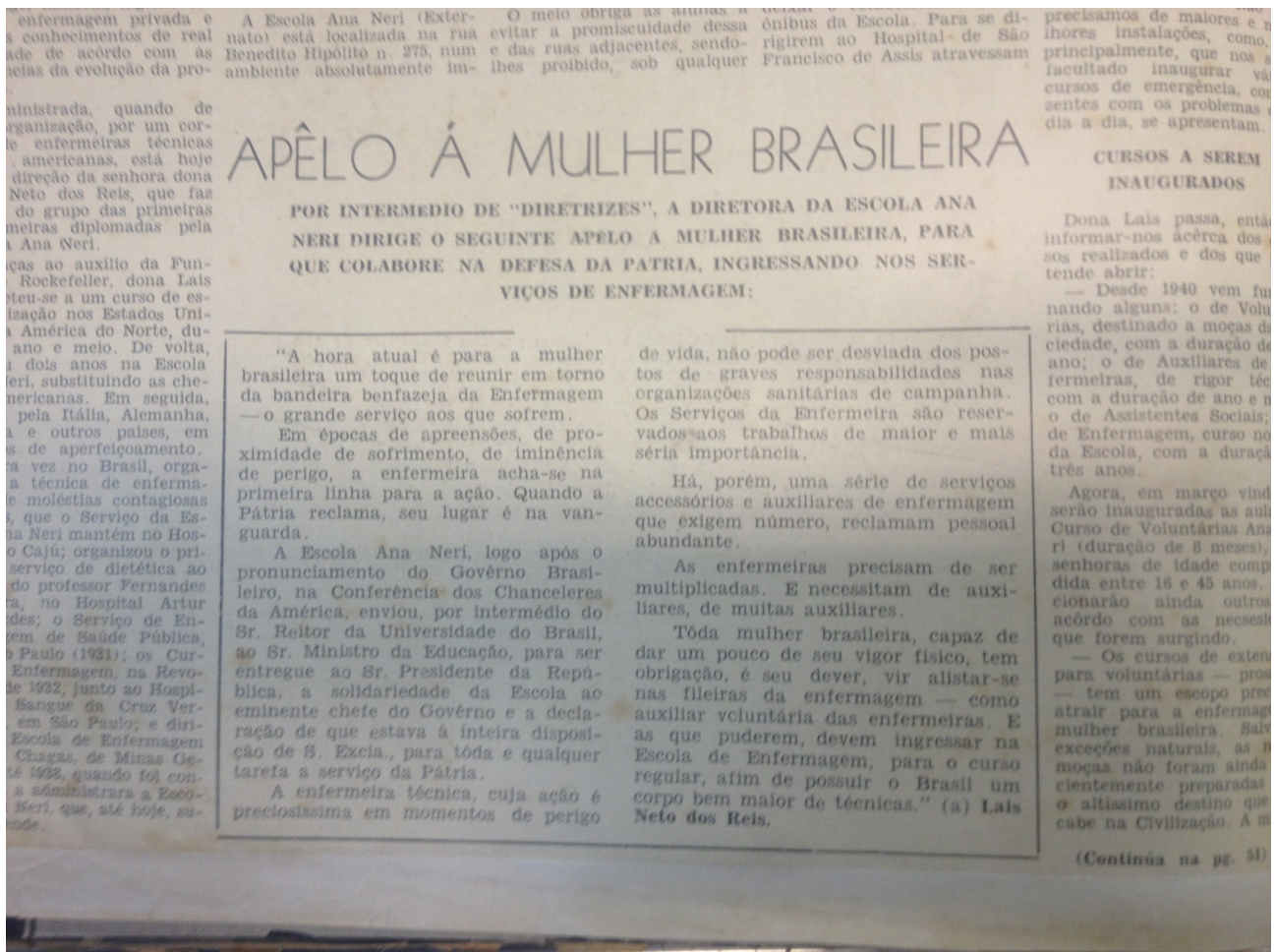
Figura 6 - "Apêlo à mulher brasileira".