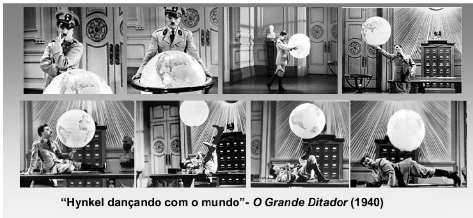
Figura 9: Imagens do filme ‘O Grande Ditador’ (1940)

Enquanto a indústria hollywoodiana silenciava-se sobre a expansão do nazismo pela perseguição de judeus - enquanto este era um dos pilares para a realização de projeto ideológico. Charles Chaplin, em 1938, inicia a primeira crítica direta e explícita ao regime de Hitler. As filmagens de 'O Grande Ditador' (The Great Dictator) são feitas no pleno começo da Segunda Guerra Mundial e sua instalação de confrontos na Europa.