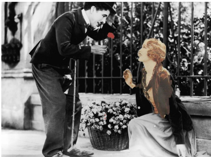
Figura 8: Imagem modificada do filme ‘Luzes da Cidade’ (1931)

O Vagabundo dá esperanças de que pagaria o aluguel e restauraria a visão da moça. Esse romance não termina com uma flor que Chaplin segura com carinho.