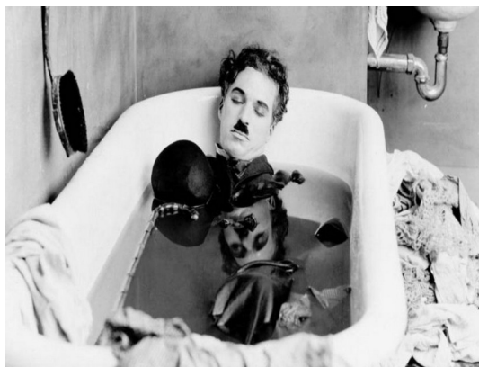
Figura 7: A morte do vagabundo

A figura abaixo suscita, por interpretação do autor deste texto, uma relação à temática deste trabalho. O momento histórico, essa fase final do cinema mudo, no qual vivia Carlitos. Na banheira está a morte desse personagem e o nascimento de um ator em cena representado pelo ator Charlie Chaplin. Essa dedução torna emblemática a imagem de quem está nesse lugar, como não sendo mais o que era, ou seja, o Vagabundo, Carlitos, Tramp , Hobe , entre tantos outros nomes para o mesmo personagem, que de tão simples é extremamente complexo.