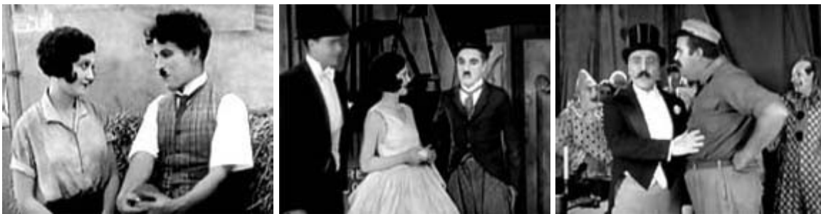
Figura 4: Cenas do filme “O Circo” (1928)

Neste filme, Chaplin simplesmente desenvolve tudo, ou seja, exerce funções de diretor, roteirista, produtor, editor e trilha sonora. Aqui, ele critica o capitalismo com a figura do dono do circo que representa o empresário explorador, enquanto o vagabundo representa o trabalhador que é extremamente explorado.