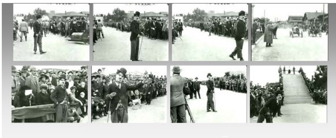
Figura 3: Cenas do filme Kid Auto Races at Venice (1914)

O Vagabundo (também conhecido por Carlitos ou Tramp ) passou a ser símbolo da parcela da sociedade compreendida como desnecessária do ponto de vista econômico. Esta é composta por aniquiláveis, i.e, a população improdutiva, pois são tomadas como invisíveis pelos que consomem as mercadorias do mercado (e, por isso, possuem direitos). Entretanto, os que não podem consumir, no caso representado pela figura do Tramp , são privados dos direitos mais fundamentais ao homem, enquanto ser humano, tais como: direito à saúde, educação e moradia. E, de maneira geral, esses indivíduos sujeitos a toda forma de sorte ou azar do mundo capitalizado e, regido pelo viés monetário, provém de um contexto inóspito às estratégias elucidativas da real exploração e seu posicionamento social. (SILVA, 2004)