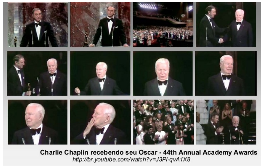
Figura 6: Chaplin recebe o Oscar Honorário

Como forma de reconhecimento, mesmo sendo perseguido politicamente, Chaplin retorna aos EUA em 1972 para receber o Oscar Honorário, quarenta e três anos após o primeiro Oscar recebido por ele pelo mesmo filme. Chaplin foi ovacionado de pé, conforme pode ser visto na figura a seguir: