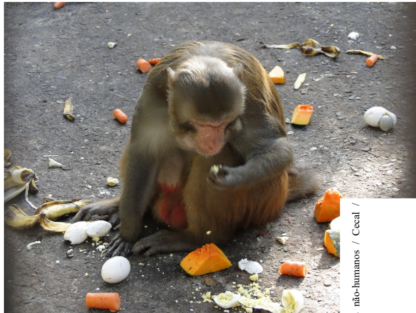
Macaco Rhesus ( Macaca mulatta ) macho alimentando-se, recolhendo para si variados itens do cardápio (ovos cozidos, abóboras, cenouras e bananas).