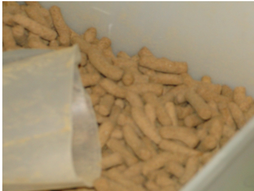
Figura 14 - Ração seca constituída de ração comercial peletizada (Serviço de Criação de Primatas não-humanos / Cecal / Fundação Oswaldo Cruz).

Agradecimentos ao Serviço de Criação de Primatas não-humanos / Cecal / Fiocruz - 2011. Fotografia de Simone Ribeiro.