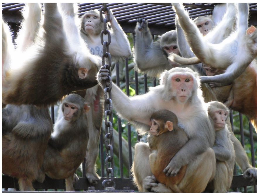
Fêmea mais velha, de pelagem mais esbranquiçada, na companhia de dois filhotes. Ao seu redor observa-se pelo menos mais duas fêmeas mais jovens com seus próprios filhotes.