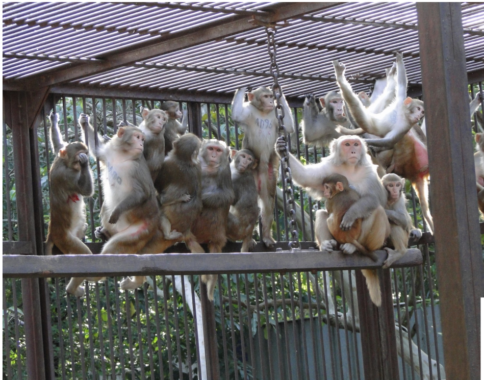
Grupo de macacos Rhesus ( Macaca mulatta ) em uma das gaiolas de reprodução coletiva do Deprim, organizadas de acordo com o sistema de haréns, demonstrando diversas faixas etárias encontram-se reunidas nas grades e nos poleiros.