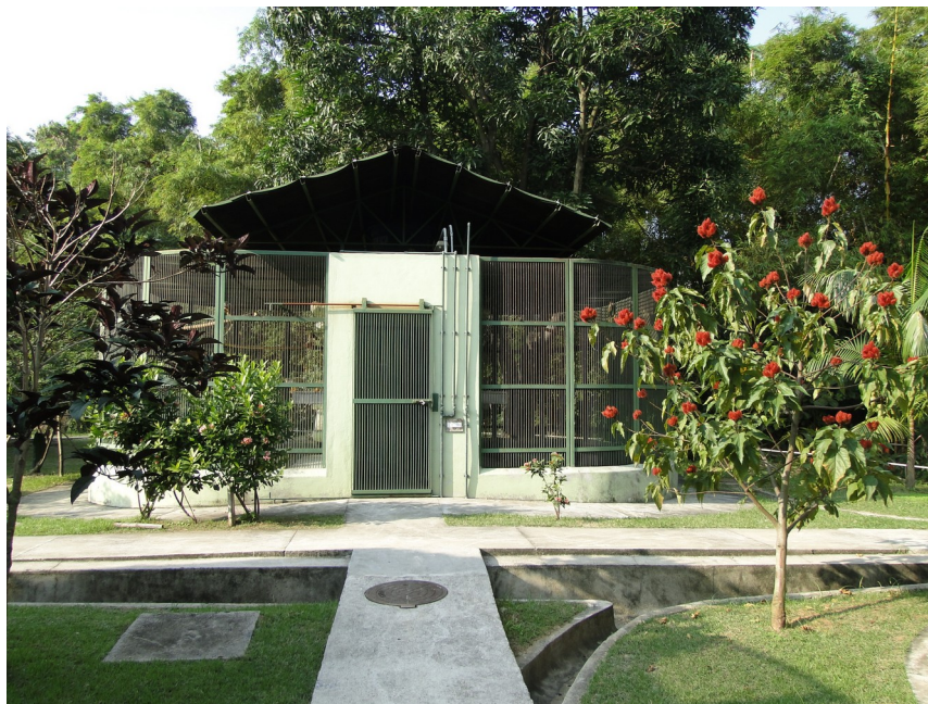
Figura 6 - Gaiola de reprodução coletiva da colônia de micos de cheiro ( Saimiri ) Serviço de Criação de Primatas não-humanos / Cecal / Fundação Oswaldo Cruz

Agradecimentos ao Serviço de Criação de Primatas não-humanos / Cecal / FioCruz - 2011.