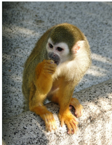
Figura 3 - Mico de cheiro ( Saimiri sp.) do Serviço de Criação de Primatas não-humanos / Cecal / Fundação Oswaldo Cruz.

Agradecimentos ao Serviço de Criação de Primatas não-humanos / Cecal / Fiocruz - 2011.