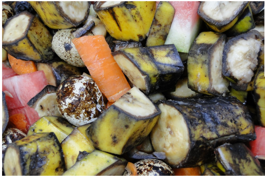
Frutas cortadas e dispostas para fornecimento à espécie Mico de Cheiro ( Saimiri sp.).

Além da vantagem de minimizar o estresse animal, a ração úmida é fonte de vitaminas, minerais e fibras, necessárias ao bom funcionamento gastrointestinal dos animais (ANDRADE, 2002). A oferta desses alimentos in natura , participando de um cardápio variado, constitui um tipo de enriquecimento alimentar, aproximando as condições de cativeiro das condições de vida livre. Enquanto a criação em cativeiro diminui a variedade de alimentos ofertados e fixa-os em um horário específico, a oferta de diferentes alimentos naturais traz consigo desafios cognitivos naturais (ANDRADE, 2010). Um exemplo está na figura 11, em que é mostrado o oferecimento de ovos cozidos e bananas ainda em casca. O exercício de retirar o ovo e a banana da casca é um exercício que simula as condições naturais (Figura 11).