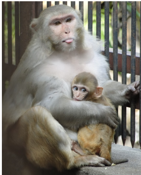
Figura 1 - Macacos Rhesus ( Macaca mulatta ) do Serviço de Criação de Primatas não-humanos / Cecal / Fundação Oswaldo Cruz

Agradecimentos ao Serviço de Criação de Primatas não-humanos / Cecal / Fiocruz - 2011.