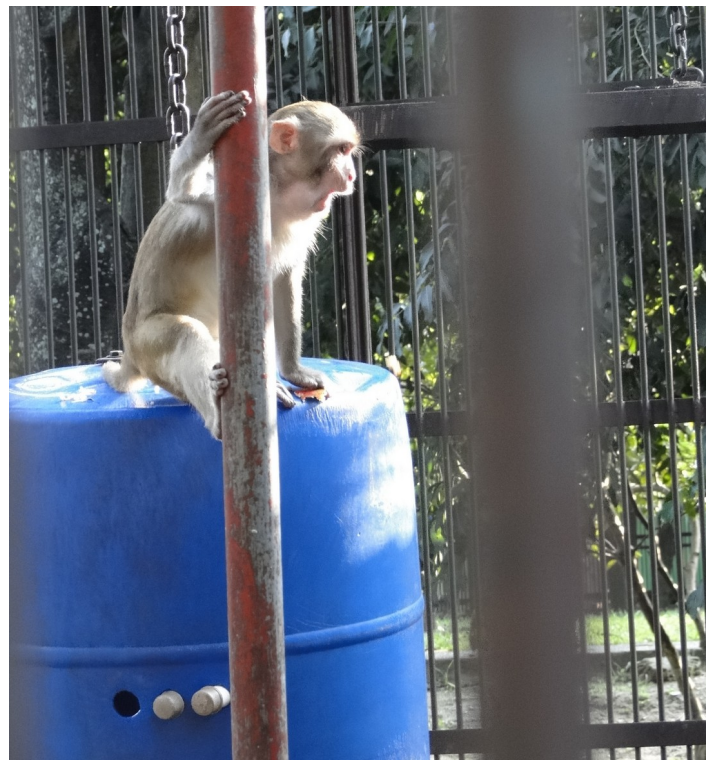
Figura 7 - Dispositivo de enriquecimento ambiental do Serviço de Criação de primatas não-humanos / Cecal / Fundação Oswaldo Cruz.

O enriquecimento ambiental envolve as categorias de enriquecimento ambiental, alimentar, cognitivo, sensorial e social. Trata-se da introdução de objetos diversos como brinquedos, poleiros, ninhos, cordas, redes, pneus, mangueiras, utilizando alimentos e de novas formas de distribuí-los, ou da introdução de estímulos externos. Tais medidas funcionam como atividades lúdicas para evitar o estresse do animal (ANDRADE, 2010) (Figuras 7 e 8).