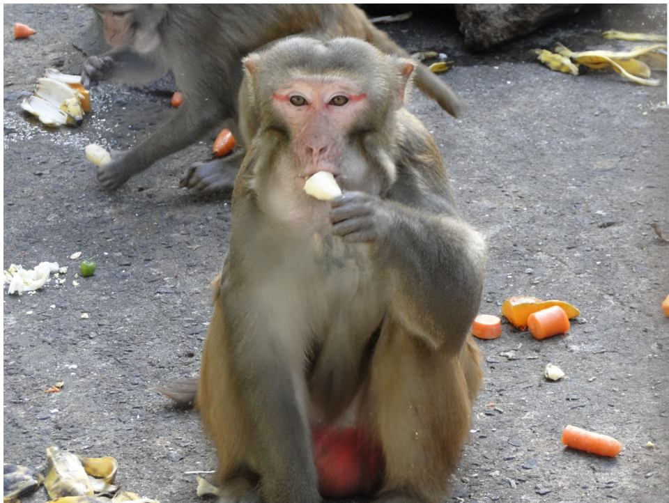
Figura 11 - Macho adulto no exercício de alimentação, Serviço de Criação de Primatas humanos / Cecal / Fundação Oswaldo Cruz.

Macho adulto, provavelmente o líder do grupo, armazenando alimentos em sua bolsa gular 24 . As cascas de ovos sugerem o exercício da retirada dos ovos cozidos da casca para a alimentação.