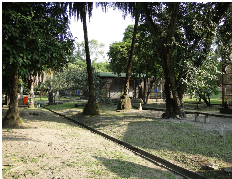
Agradecimentos ao Serviço de Criação de Primatas não-humanos / Cecal / FioCruz - 2011.

Dependendo da necessidade do status sanitário, os primatas de laboratório podem ser alojados em gaiolas de reprodução coletivas, visto que o recinto individual pode ocasionar situações de estresse e depressão nesses animais (ANDRADE, 2010) e por estes serem animais de intenso convívio social, apresentando relações localizadas em diferentes níveis hierárquicos entre os indivíduos. A criação em grupo é realizada em sistema de harém, na proporção de um macho para 3 a 12 fêmeas, obedecendo aos padrões da literatura (ANDRADE, 2002), considerando somente os indivíduos de uma mesma espécie compatíveis entre si (MOLINARO, 2008) (Figuras 4 e 5).