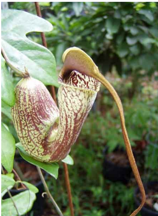
Figura 10: Aristolochia macroura – conhecida vulgarmente como jarrinha.