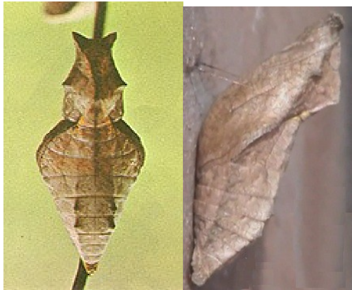
Figura 7 : Crisálida de P. ascanius .

desenvolvimento e aumentar seu tempo como crisálida, retardando assim sua fase adulta e podendo vir a eclodir somente seis meses depois (OTERO, 2005)