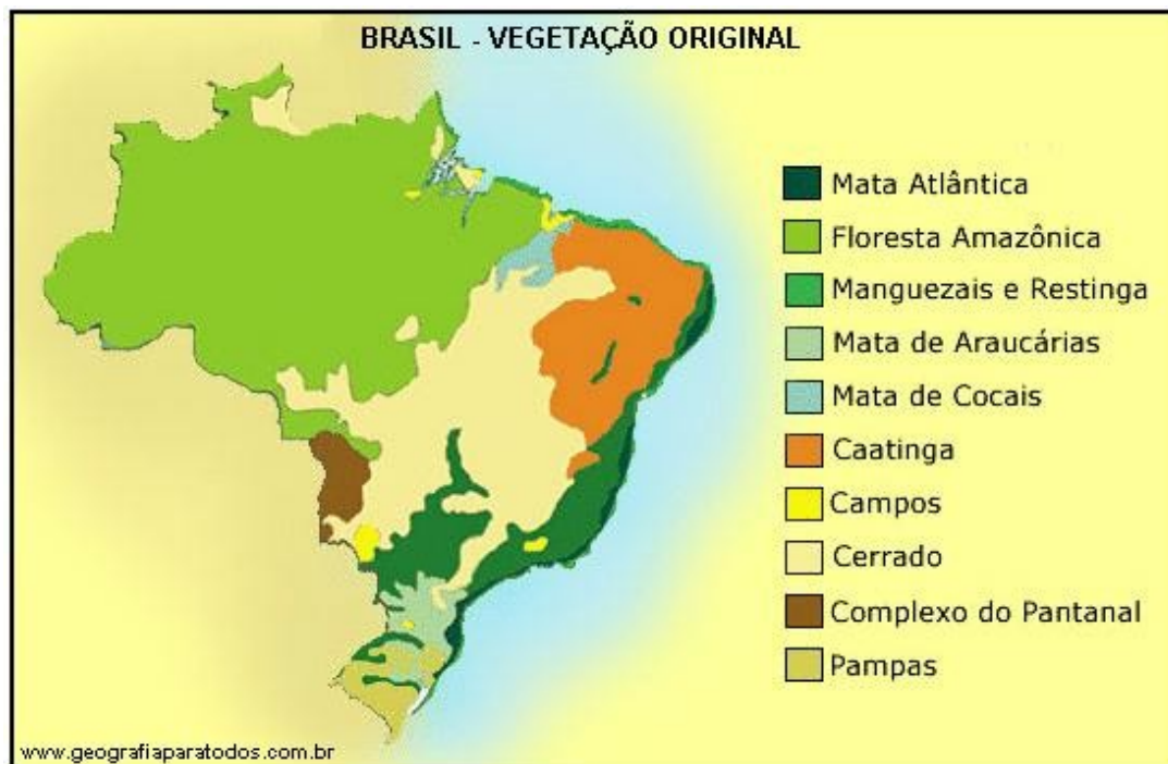
Figura 12 – Mapa da vegetação original do Brasil.