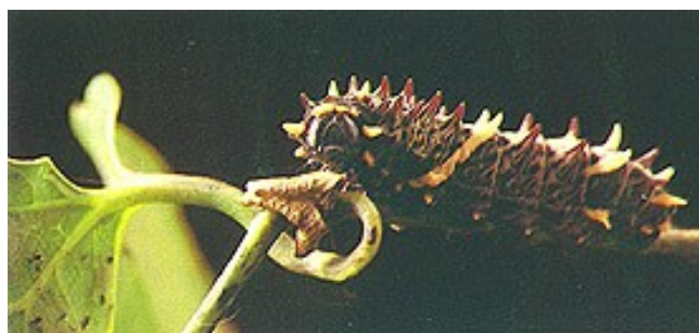
Figura 6: Lagarta (larva) de P. ascanius .

Ao se alimentar da sua planta hospedeira, a lagarta obtém os alcalóides tóxicos, “os ácidos aristolóquicos (AAs) – derivados nitrofenantrênicos – reconhecidos por serem universalmente tóxicos às larvas de Lepidópteras e ao homem” (FRANCISCO, MACHADO, MESSIANO e LOPES, 2007: p.1), que irão protegê-la de possíveis predadores, pois as torna impalatável. Enquanto lagarta (figura 6), a P. ascanius passa por cinco mudas, que duram em torno de um mês (HERKENHOFF, 2006).