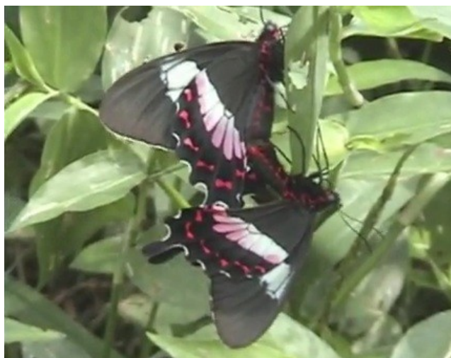
Figura 2: Cópula Casal de P. ascanius

Quanto ao comportamento sexual destas borboletas, sabemos que os machos fazem vôos ao redor de fêmeas que ficam paradas. Então os machos abrem suas asas posteriores e depositam, durante com movimento destas asas, escamas em forma de penugem branca cheias de feromônio nas antenas das fêmeas. Em seguida ocorre a cópula, que pode durar algumas horas, como mostra a figura 2 (HERKENHOFF, 2006).