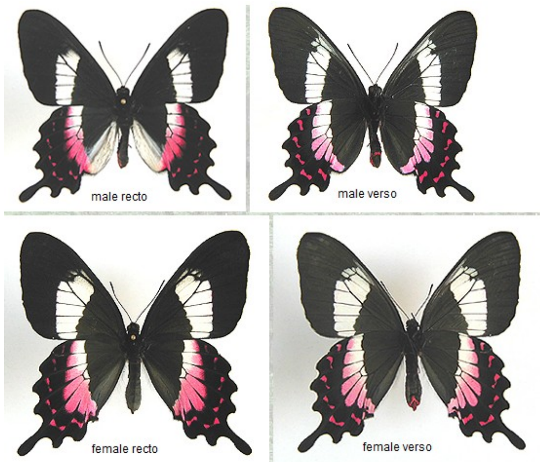
Figura 1: P. ascanius

A P. ascanius tem como principal característica morfológica sua coloração negra e nas asas, tendo geralmente tons brancos na face superior e tons rubros na face inferior das asas e chegando a ter 7,5 cm de envergadura. A face inferior das asas da P. ascanius lembra uma cauda de andorinha (figura 1) e é por isso que ela é conhecida fora do Brasil como Fluminense Swallowtail.