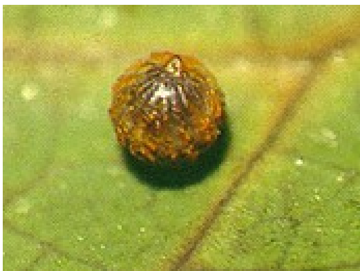
Figura 3: Ovo de P. ascanius