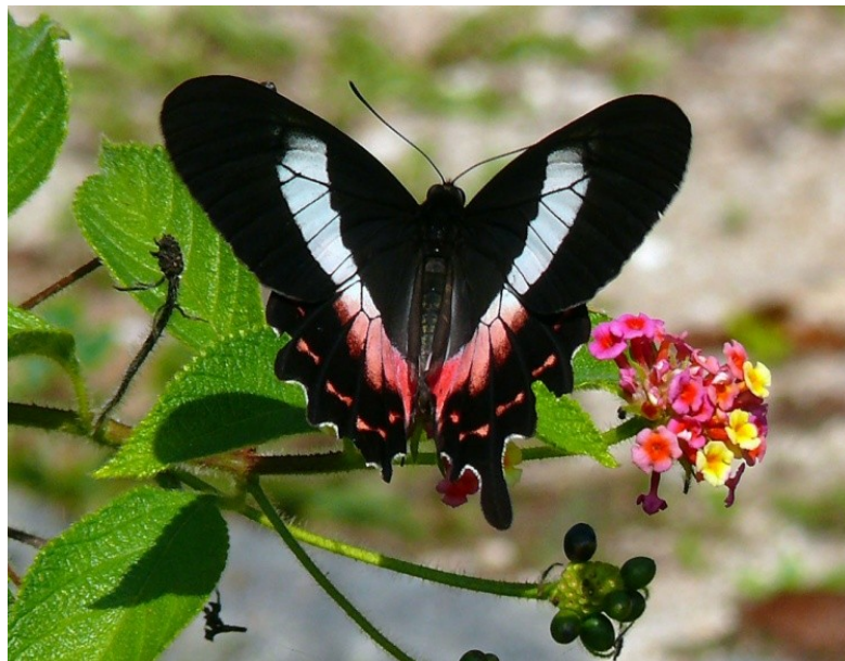
Figura 9: P. ascanius .

Esta borboleta pode ser vista voando em áreas abertas ou descansando em áreas com sombras. Em geral encontrada em áreas de sombra nas horas mais quentes do dia, ou quando está a procura de uma planta para desova (OTERO,2005).