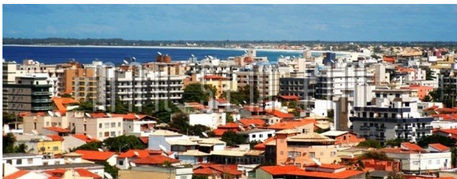
Figura 13: Crescimento abrupto de Construções - Especulação Imobiliária em Cabo Frio

A inauguração da Ponte "Presidente Costa e Silva", no ano de 1974, e a fusão que permitiu a criação do atual Estado do Rio de Janeiro, trouxeram ao interior do estado e, principalmente para a Região das Baixadas Litorâneas, um princípio de euforia natural e o prenúncio de novos tempos que, trinta e sete anos mais tarde, as mudanças mostrariam impotentes face aos problemas sócio-ambientais decorrentes da falta de ação para disciplinar o uso do solo de forma a minimizar os impactos sobre os ecossistemas locais. A partir da década de 80, se observa em Cabo Frio e nas cidades vizinhas, uma pressão muito grande por parte da especulação imobiliária e da indústria da construção civil, função de seus atraentes recursos para o turismo de 2ª moradia. Outro fator significativo é o crescimento da atividade de exploração do petróleo, e o fato do dinheiro recebido pelos royalties nunca ter sido usado para políticas eficazes de proteção ambiental (LOPES, 2011).