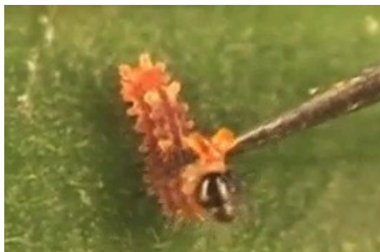
Figura 5: Osmetério da P. ascanius