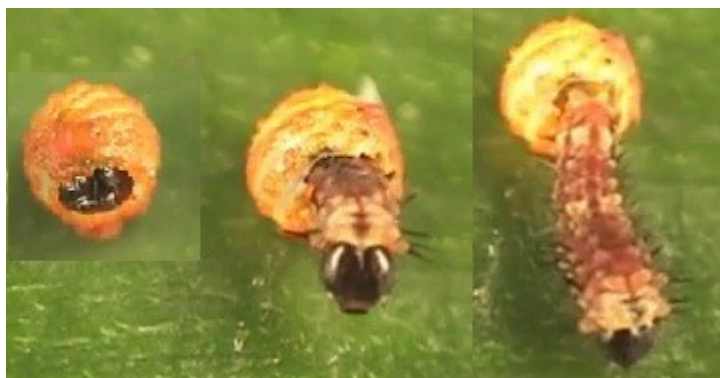
Figura 4: P. ascanius Eclodindo

Após sete dias da desova – geralmente já na planta hospedeira, no caso da P. ascanius , a Aristolochia macroura , conhecida vulgarmente como jarrinha – a larva eclode do ovo consumindo-o, como seu primeiro alimento (figura 4) (HERKENHOFF, 2006.)