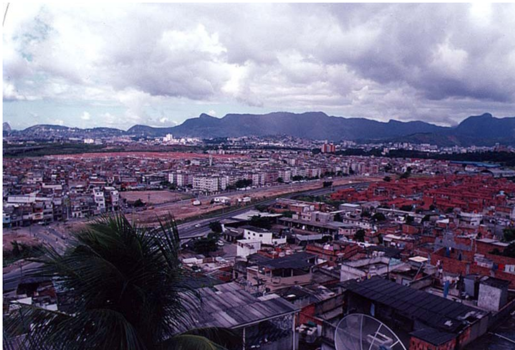
Figura 5 - Vista Geral dos Conjuntos Pinheiro e Vila do João, onde outrora ficava a enseada de Manguinhos. 1998.

Nos anos 80 o Complexo da Maré sofreu uma grande intervenção do governo Federal, foi o Projeto Rio. Este projeto visou o aterramento das regiões alagadas e a construção de moradias para abrigar os antigos moradores das palafitas. Essas regiões formam a atual Comunidade da Vila do João (1982), Vila dos Pinheiros (1989), Conjunto Pinheiro (1989) e Conjunto esperança (1982). O novo conjunto habitacional, a Vila do João, abrigou os moradores cujos barracos tinham sido derrubados pelo projeto Rio. Recebeu essa denominação em homenagem ao então presidente da República João Batista Figueiredo, responsável pela sua inauguração durante a campanha para o governo do Estado em 1982.