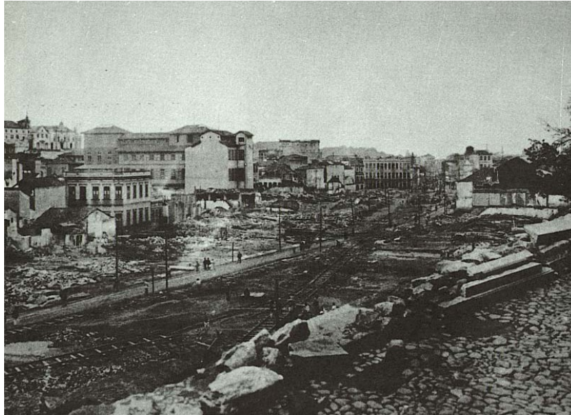
Figura 3-Obras na Avenida Central no famoso “bota - abaixo”. a. Augusto Malta. d.1903. Acervo do Arquivo Geral da Cidade.