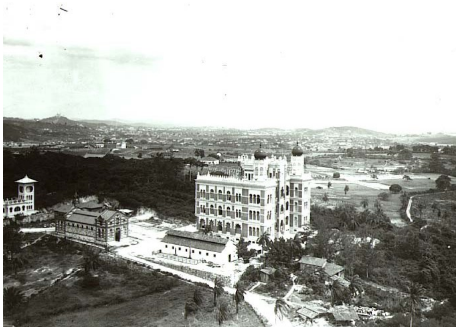
Figura 2 - O Palácio de Manguinhos e arredores. d.1910. Acervo Casa de Oswaldo Cruz Fonte: VIEIRA, p.32

A região do litoral de Inhaúma foi o local onde se instalou o Instituto Oswaldo Cruz. Considerado uma Instituição muito importante acabou por chamar atenção da cidade para essa região, que precisava de uma melhor infra-estrutura e melhores meios de transporte, devido à importância do Instituto.