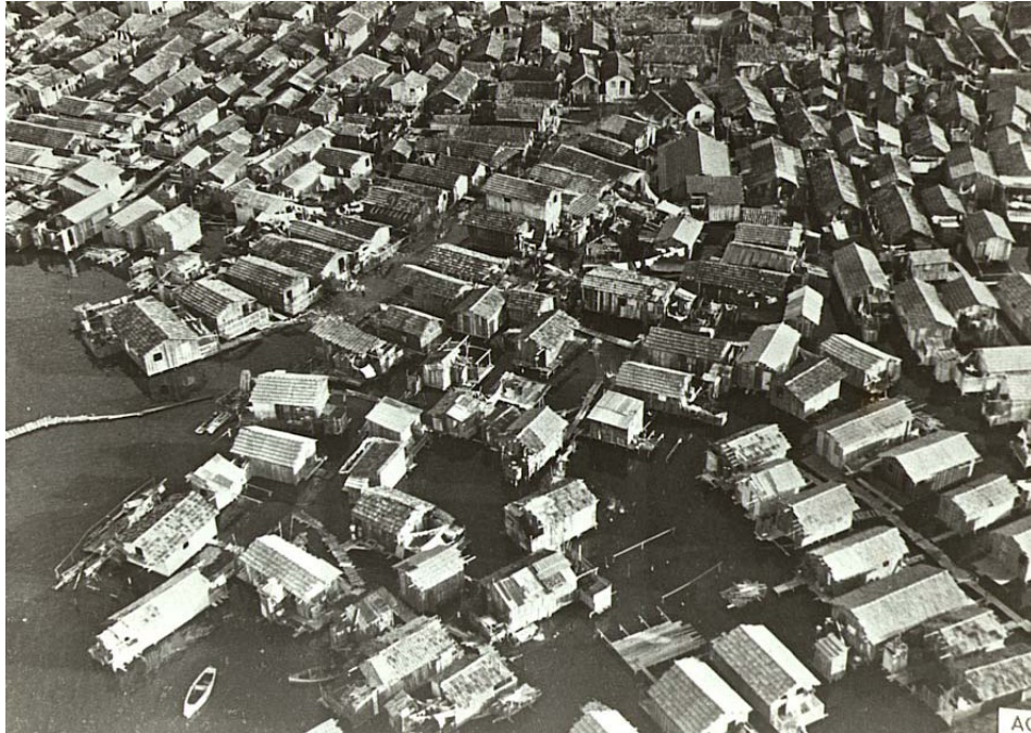
Figura 4 - Vista das Palafitas da baixa do Sapateiro. s/d. s/a.

Timbau (1940), este último era o único de terra firme. A comunidade Baixa do Sapateiro caracterizava-se por apresentar uma imensa vegetação de mangues sendo considerada uma das mais antigas. A área do Parque Maré era composta por lamas, pelos mangues e pelo movimento das águas. Estas construções se espalharam por toda a área da Maré e só foram deixadas de lado no início dos anos 80.