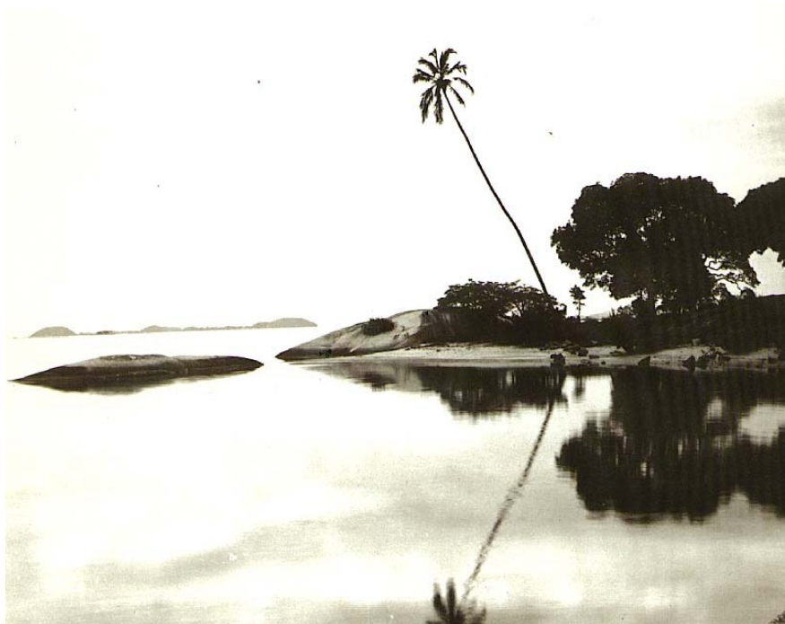
Figura 1- Paisagem de ilha, c. 1885, Marc Ferrez

Na época do descobrimento do Brasil, a região da Maré era habitada pelos índios Tupi-Guarani, que tiveram como ancestrais os índios Tupinambás. Nessa época, Amador apud Vieira (p.02), existia cerca de 50 a 40 aldeias Tupis-Guaranis ao redor da Baía de Guanabara. Essa região da Bahia de Guanabara foi habitada há muitos anos atrás por coletores e pescadores devido à grandiosidade dos recursos provenientes da Baía de Guanabara. A região caracterizava-se pela predominância dos manguezais, das elevações, das Ilhas e pela grande vegetação, destacando a presença do pau-brasil.