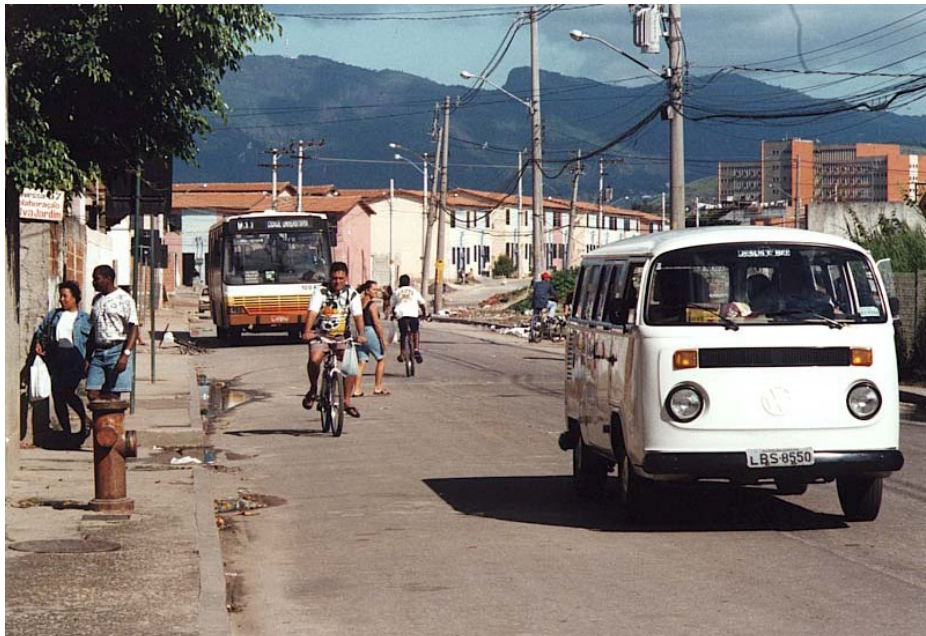
Figura 6 - Cotidiano na Vila do Pinheiro, tendo ao fundo o novo Conjunto da Prefeitura apelidada “Salsa e merengue”. 1998.

O reconhecimento como bairro veio de fato com a instalação da 30ª Região Administrativa, ou seja, a primeira R.A que foi localizada em uma favela no ano de 1988. Para abrigar os moradores de outras partes da cidade que estavam em áreas de risco foram construídas nos anos 80 e 90 as comunidades: Nova Maré (1996) e Bento Ribeiro Dantas (1992). As residências construídas tinham uma estética própria inspirada no pós-modernismo, foram utilizados tijolos e concreto aparentes, diferentemente dos prédios modernistas do Conjunto Pinheiros. E por fim a comunidade Salsa e Merengue, inaugurada no ano 2000 é considerada uma extensão da Vila dos Pinheiros e recebeu esse nome devido a uma novela famosa da época.