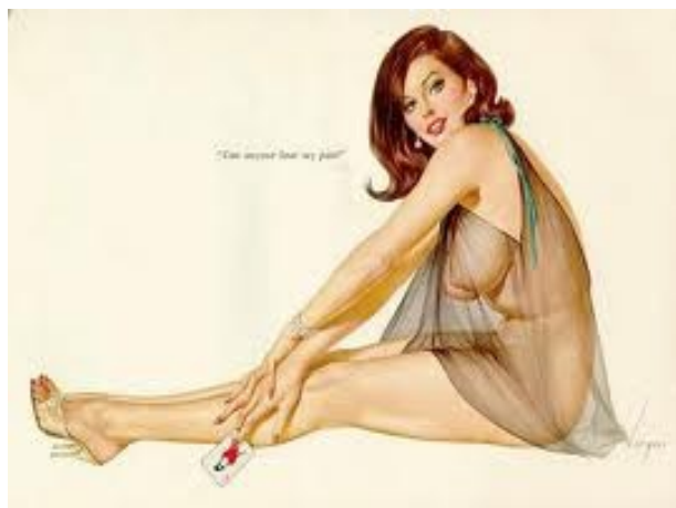
Figura 7 – Imagem de uma Varga Girl

Abordaremos inicialmente as Pin Ups de Vargas, que como já foi dito anteriormente, inseriram o conceito de mulher fatal naturalizando não só o corpo, mas como também a sexualidade feminina. As Vargas Girl (Figura 7) tinham como