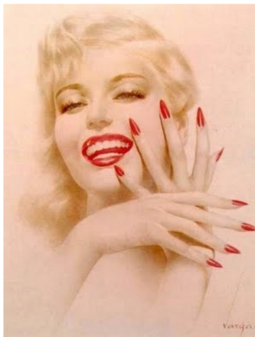
Figura 6 – Uma das ilustrações de Marilyn Monroe feita por Vargas

Com os dados avanços tecnológicos da época, a arte de fotografar tornou-se mais disponível devido às facilidades implantadas para o manuseio das câmeras e algumas revistas, portanto adotado tais máquinas e criando assim técnicas para ajeitar o corpo de suas modelos ao que eles queriam mostrar, uma vez que a fotografia acabava fazendo o real se mostrar real, os desenhos nada mais eram que imagem de mulheres idealizadas por seus criadores, daí o porquê de ser a mulher ideal, ela era apenas concebida na idéia e reproduzida no papel, seu corpo não era o corpo da mulher da sociedade e sim algo que a sociedade deveria se espelhar a ser, as Pin Ups, a partir de um certo momento torna-se o objeto de desejo mundano ,já que essas personagens com o tempo começaram a ganhar um rótulo de mulher objeto a partir do momento em que o conceito de mulher/doméstica começa a ser novamente enaltecido pela massa masculina, tomando como pressuposto que após a guerra a vontade de ficar com a família reunida, com a mulher segura dentro e os filhos brincando era de grande parte dos soldados e homens civis, tendo em vista que outra guerra poderia vir. Portanto as Pin Ups vão sendo criadas para suprir uma necessidade visual/sexual da massa masculina.