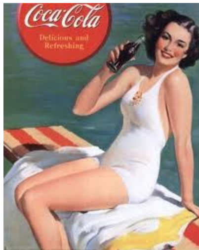
Figura 1 – Ilustração de Gil Elvgren para Coca-Cola

Com cada vez mais reconhecimento, as Pin Ups começam a inspirar outros artistas tais como Gil Elvgren, que ficou reconhecido nos anos 20 pelo seu grande apelo comercial uma vez que suas ilustrações eram destinadas a propagandas de grandes marcas como a Coca-Cola (Figura 1). Percebemos daqui que o corpo feminino já era explorado sexualmente pela propaganda, claro que em uma escala menor do que atualmente.