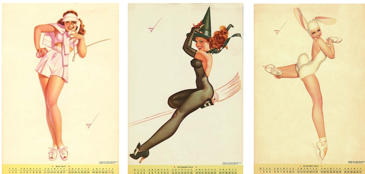
Figuras 2, 3 e 4 – Ilustrações de George Petty

Apesar de tomar com exemplo as lindas meninas de Gibson, a revista Esquire conseguiu criar um perfil próprio para suas ilustrações, pois enquanto as Gibson Girls eram retratos das mulheres americanas em posições sexies em histórias com apelo moral, as Petty Girls, como ficaram conhecidas as meninas da Esquire (Figuras 2, 3 e 4), eram inspiradas na sofisticação das mesmas mulheres em poses provocadoras só que com apelo “humorístico” e inocente.