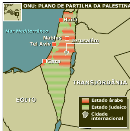
Plano de partilha da ONU (1947)