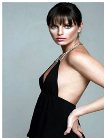
Ilustração 6 - Ana Carolina Reston