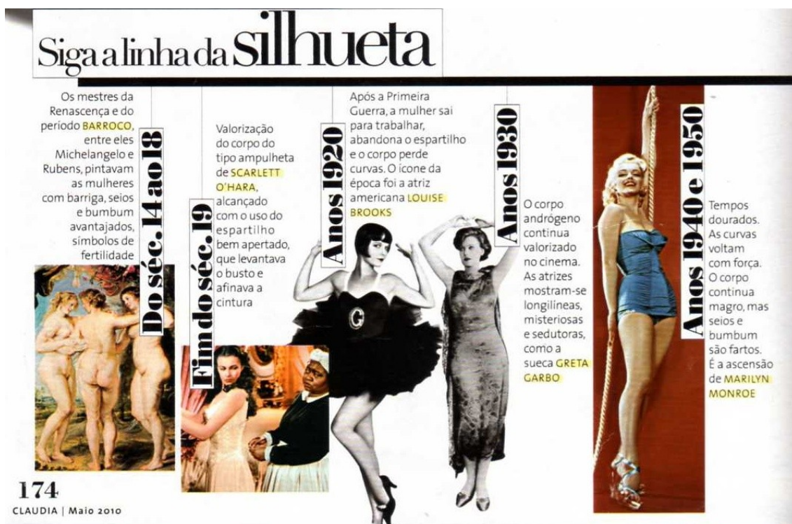
Ilustração 2 - Linha da silhueta 1

peessoas que estão por trás dos bastidores da moda, e as mulheres que sofrem preconceito, por sua vez, estão iniciando um movimento fashionista que tenta desconstruir a imagem da magreza exagerada que as modelos atuais exibem. A título de ilustração, segue uma linha do tempo publicada na revista Cláudia (SALEM, 2010):