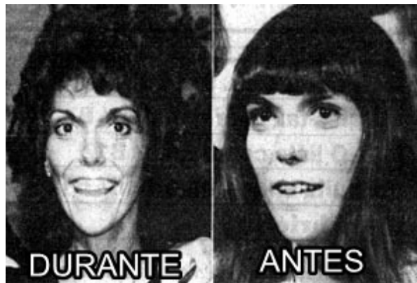
Ilustração 5 - Karen Carpenter

A anorexia nervosa já fez vítimas famosas, o que fez suscitar discussões sobre o assunto na mídia. Um dos casos mais famosos da doença foi o da cantora Karen Carpenter, que morreu no auge de sua carreira, vítima da doença. Seu irmão, Richard (que cantava junto à ela) tentou interná-la duas semanas antes de sua morte, ele alegou que Karen não parecia bem, porém a cantora disse a ele que aquilo não era problema dele e que tudo estava sob controle. No dia 4 de fevereiro de 1983, Karen Carpenter faleceu vítima de uma parada cardíaca, com 32 anos e pesando 35 quilos, mas a autópsia realizada em seu corpo revelou que a causa da morte foi uma cardiotoxicidade (complicação tóxica no coração causada pelo uso de remédios para a anorexia em excesso, ela tomava 10 vezes mais remédios do que fora receitado), seguida por anorexia e caquexia, em função de seu baixo peso e fraqueza corporal. (WIKIPEDIA, 2010).