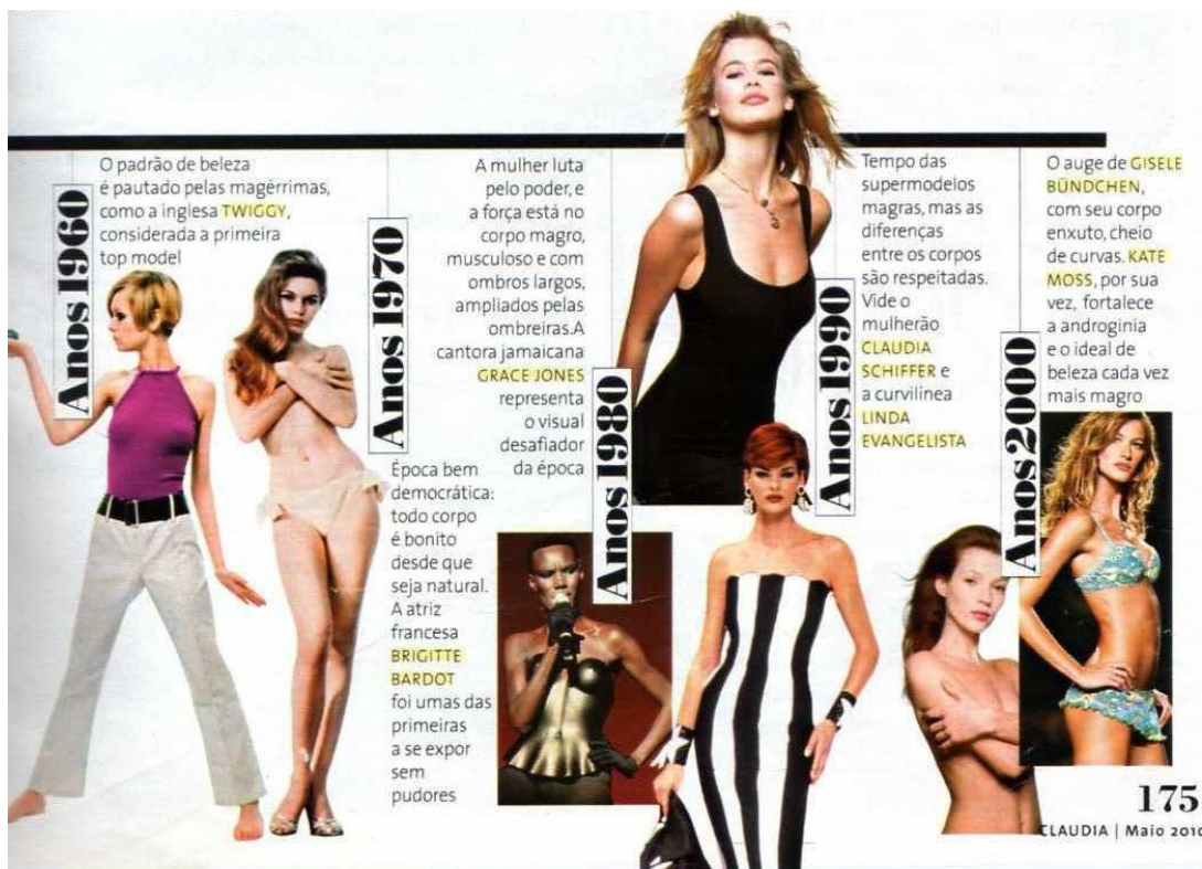
Ilustração 3 - Linha da silhueta 2