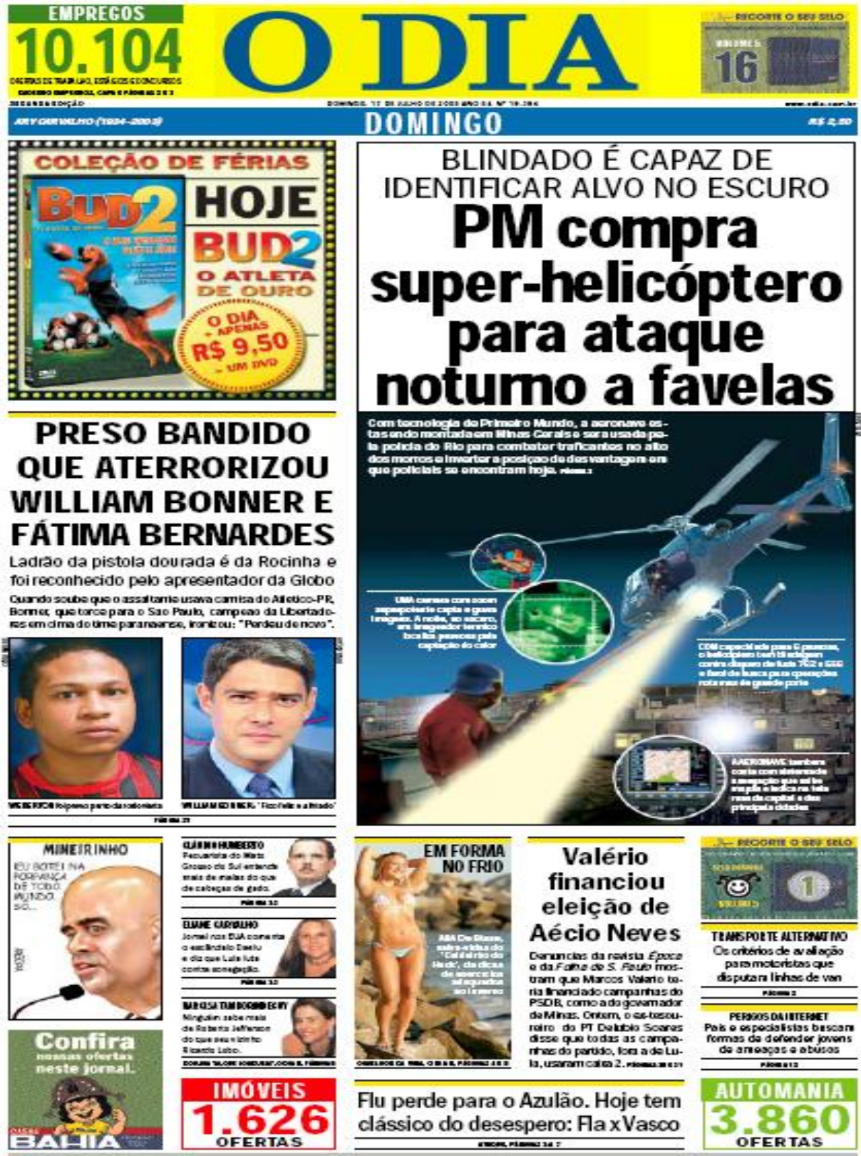
Figura II – Capa do jornal “O Dia” (17/07/2005).

papel da imprensa como um meio de comunicação, como é o caso da figura II que reproduz a capa do jornal O DIA.