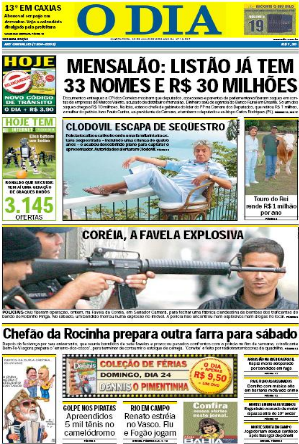
Figura I – Capa do jornal “O Dia” (20/07/2005).