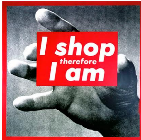
Figura 3 Fonte: Compro logo existo . Barbara Kruger 1987. Design Culture, 2017

O sistema-capitalista no qual estamos inseridos já percebeu que nossas identidades não são mais sólidas, e se aproveita disso, entende que constantemente estamos buscando contribuições para desenvolvimento de nossa identidade. A artista conceitual Barbara Kruger expressa essa crítica através de sua obra I shop therefore I am , traduzido do inglês: eu compro logo existo (GROSENICK, 2005).