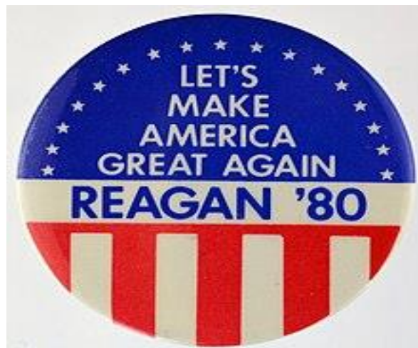
FIGURA 5 – BÓTON DA CAMPANHA PRESIDENCIAL DE 1980 DE RONALD REAGAN, EM PORTUGUÊS: “VAMOS TORNAR A AMÉRICA GRANDE DE NOVO”