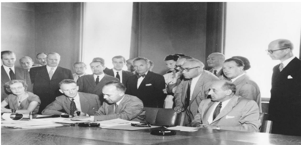
FIGURA 1 – ASSINATURA DA CONVENÇÃO DE 1951

Não obstante, mesmo sendo o pilar da proteção aos refugiados, a atuação do ACNUR ainda era restrita somente aos europeus (ACNUR, 1951).