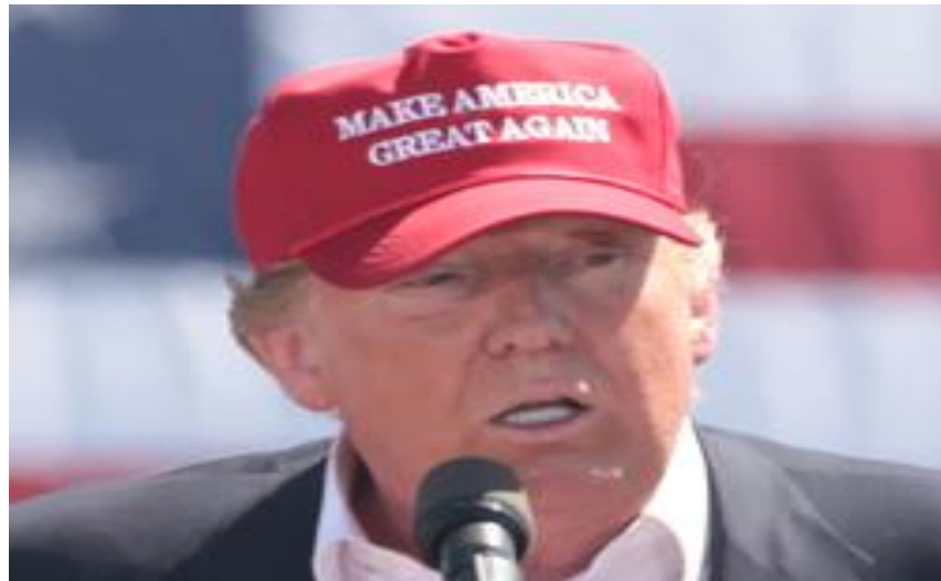
FIGURA 4 –DONALD TRUMP USANDO UM BONÉ COM O SLOGAN "MAKE AMERICA GREAT AGAIN" DURANTE SUA CAMPANHA PRESIDENCIAL EM 2016.