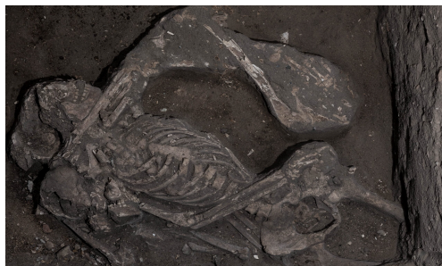
FIGURA 4 – “IPN”

ao que acontecia com os animais não-humanos, como demonstra a imagem abaixo, registrada pelo fotógrafo Alex Ferro, a qual compõe a exposição permanente do Museu Memorial Pretos Novos, pertencente ao Instituto de Pesquisa e Memória Pretos Novos (IPN), conforme a Figura 4 , abaixo.