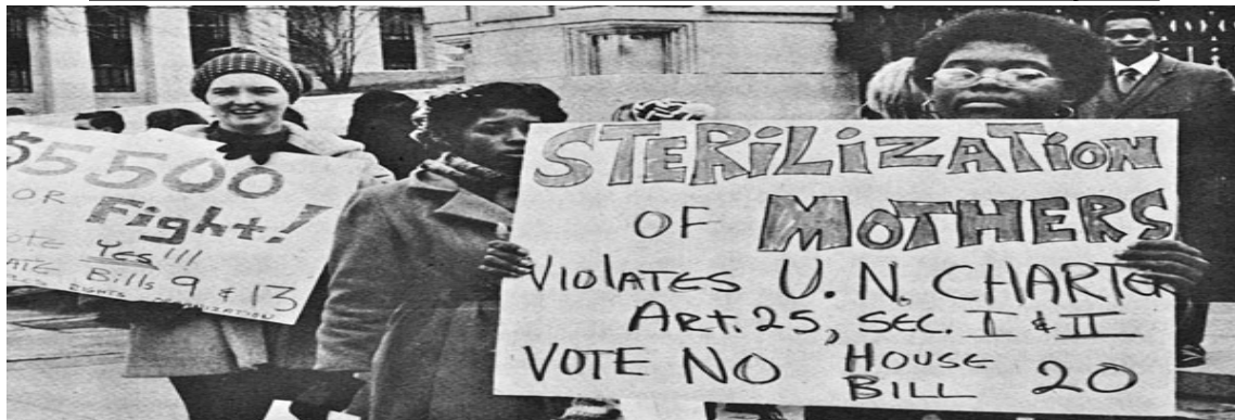
FIGURA 6 – “PROTESTO FEMININO CONTRA ESTERILIZAÇÃO”