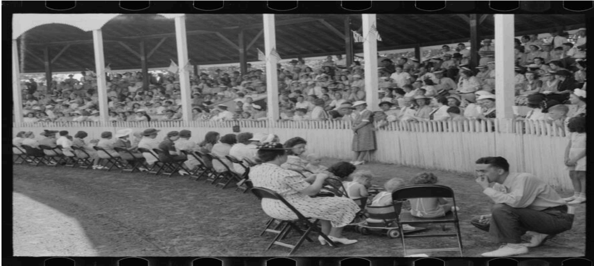
FIGURA 5 – “CONCURSO DE BEBÊS ADORÁVEIS NA FEIRA”