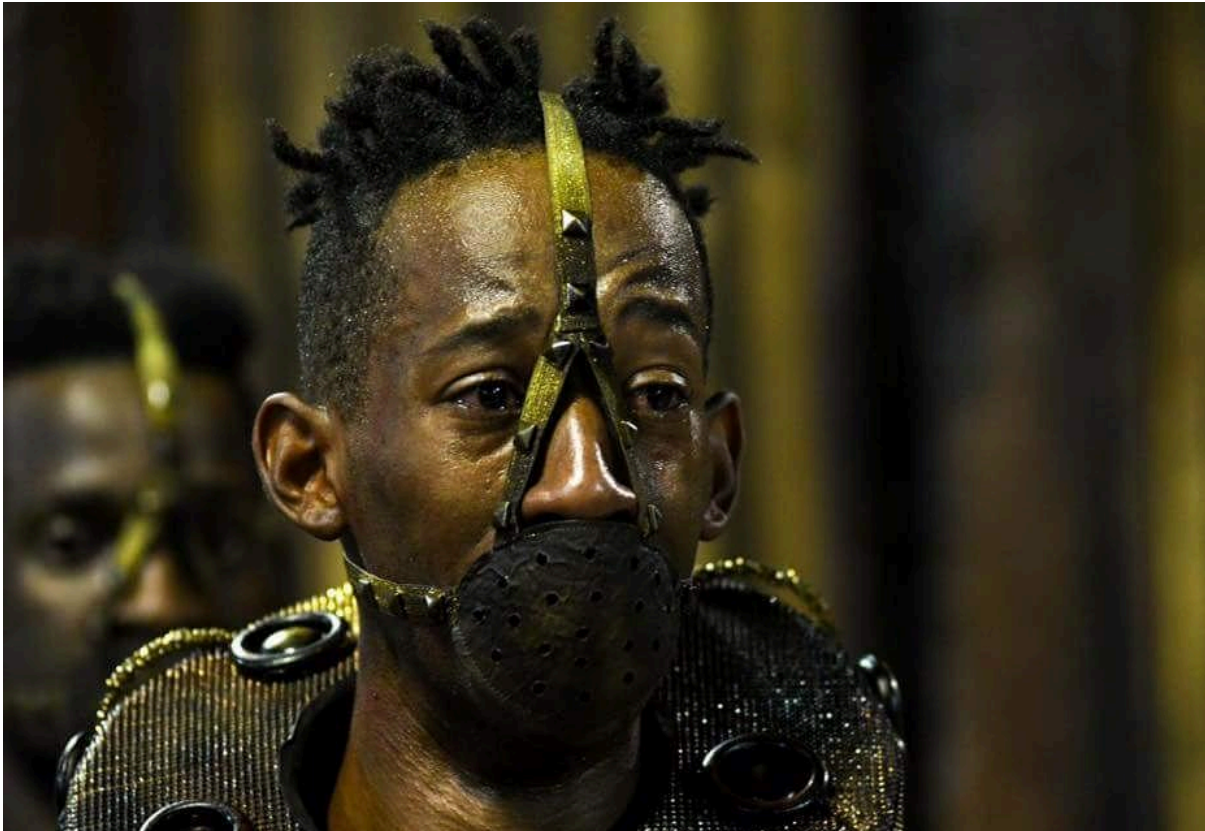
FIGURA 3 – “ROSTO DE FERRO” (2018)