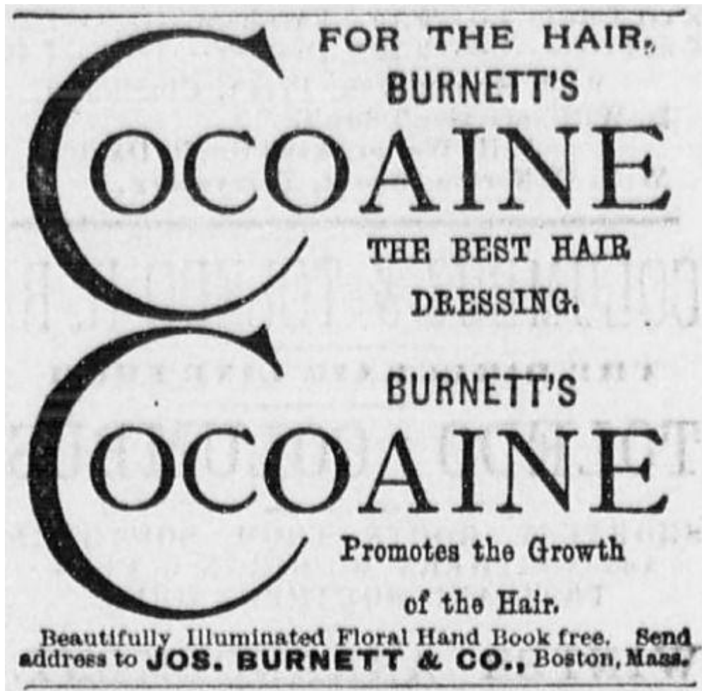
FIGURA 2 – LOGO