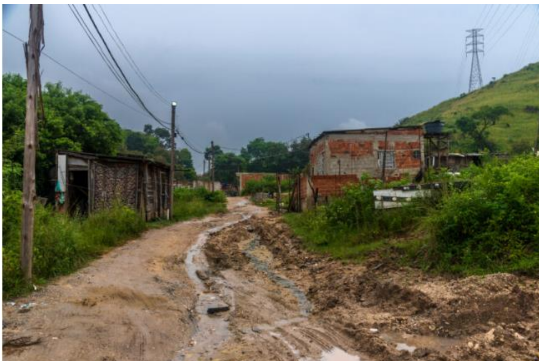
Imagem 1- Falta de asfalto da Terra Prometida

Outro problema enfrentado pela população é falta de saneamento básico, dentro do Complexo de Favelas da Penha na região da Terra Prometida que está localizada no alto Complexo. Além de sofrer com falta de saneamento básico, essa região sofre com as outras faces do racismo ambiental deslizamento de residências e perdas de residências por causa de fortes ventanias. A Secretaria Municipal de Habitação declarou que não tem nenhum de melhoria para essa região. Deixando assim a população a sua própria sorte, tendo ciência que a qualquer tempestade de chuva torrenciais pode ocorrer uma tragédia (FREITAS, 2022).