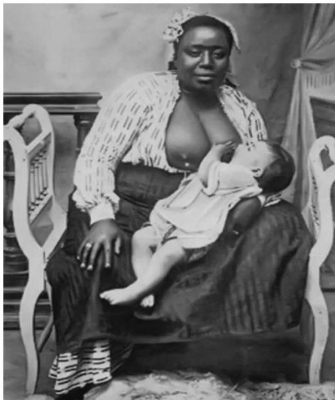
Ama de leite

Mulheres africanas receberam a pior parte dessa violência e desse terror em massa, não somente porque poderiam ser vitimadas pela sexualidade, mas também porque eram mais propensas a trabalhar intimamente com as famílias brancas 3 . O escravizador considerava a mulher negra cozinheira, ama de leite, governanta comercializável ; por isso era crucial que elas fossem aterrorizadas ao ponto de se submeter passivamente a vontade do senhor, da senhora e suas crianças brancas” hooks, 2019