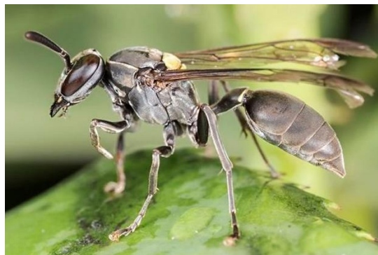
Figura 3 – Imagem ilustrativa da vespa Polybia paulista