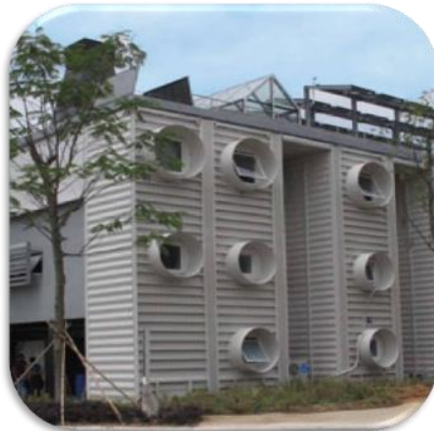
Figura 1 – Edifício Eastgate Center

A Biomimética não se trata apenas de copiar a natureza, mas de fazê-lo de forma sustentável. Isso implica em criar produtos, processos e sistemas que sejam amigáveis ao meio ambiente e que imitem os ciclos naturais. A biomimética tem como objetivo mudar a visão das pessoas do mundo no futuro, gerando energia limpa e novos materiais. Um ótimo exemplo de biomimética, é a substituição de ar-condicionado por uma tecnologia similar ao interior de cupinzeiros para se auto resfriar, como foi aplicado no edifício Eastgate Center (Figura 1), que fica localizado no Zimbábue, e criado pelo arquiteto Mick Pearce (PEARCE, 2016).