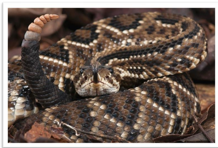
FIGURA 5 – Cobra cascavel ( Crotalus durissus terrificus )

A cobra cascavel ( Crotalus durissus ), conhecida por seu veneno potente, possui uma substância chamada crotoxina , que tem atraído a atenção da comunidade científica por seu potencial terapêutico. A crotoxina é uma proteína que, além de ser neurotóxica, tem demonstrado propriedades anticoagulantes. Os trombos, ou coágulos sanguíneos, são responsáveis por obstruir vasos sanguíneos e podem levar a acidentes vasculares cerebrais (AVCs) e outras complicações. A crotoxina age inibindo a agregação plaquetária, um processo que contribui para a formação de coágulos. Isso significa que essa substância pode ajudar a reduzir a formação de trombos e, conseqüentemente, o risco de AVCs. A crotoxina é composta por duas subunidades: uma subunidade A e uma subunidade B. A subunidade A é responsável pela atividade neurotóxica, enquanto a subunidade B se liga aos receptores nas plaquetas. Essa ligação inibe a agregação das plaquetas, reduzindo a formação de coágulos sanguíneos. Esse mecanismo torna a crotoxina um agente potencialmente útil na prevenção de trombozes e acidentes vasculares cerebrais (SOARES, 2010). De acordo com a figura 5 vemos uma imagem ilustrativa da cobra cascavel.