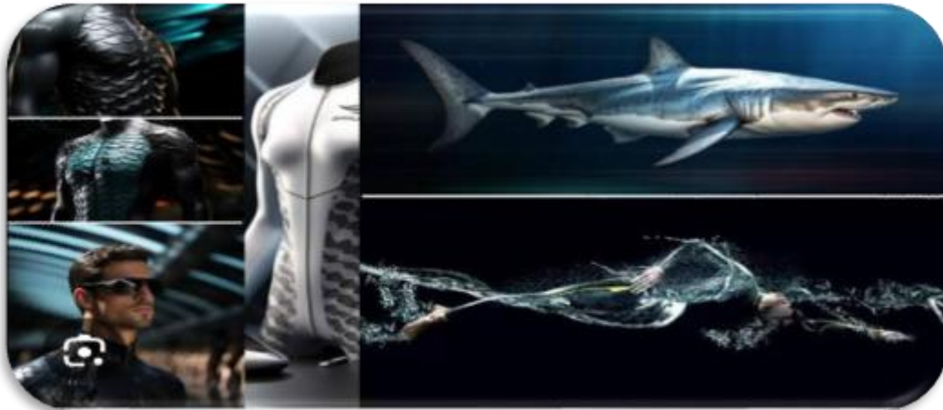
Figura 2 - Imagem ilustrativa do tecido Farstikin e do tubarão, animal que possui o material necessário para a composição deste tecido.

O Farstikin é um tecido que foi desenvolvido pela Speedo® uma marca que é responsável por produzir artigos esportivos e foi inspirado nas características da pele do tubarão, já que ele foi considerado com peixe mais rápido dos mares. Sua pele é coberta por escamas, que também é o material responsável pela formação dos seus dentes (Figura 2) (DESMET, 2007).